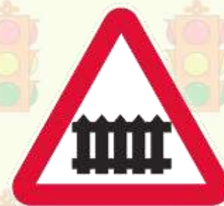
Железнодорожный переезд со шлагбаумом