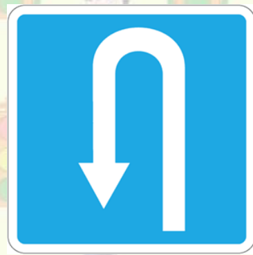
Место для разворота