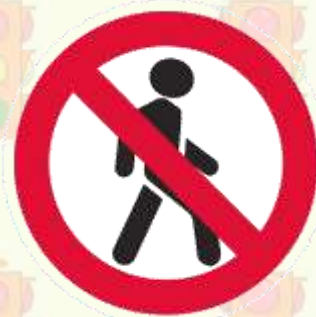
Движение пешеходов запрещено