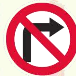
Поворот направо запрещен