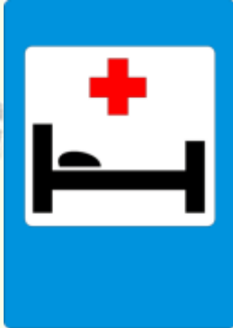
Пункт первой медицинской помощи