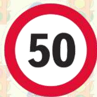
Ограничение максимальной скорости