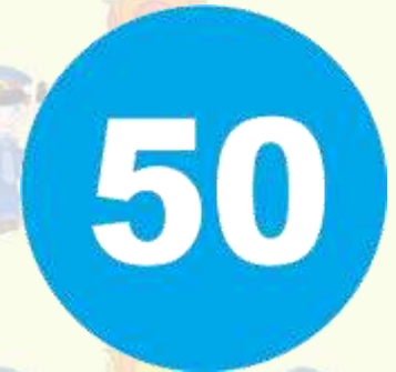
Ограничение минимальной скорости