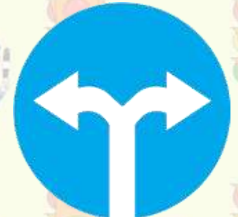
Движение направо или налево