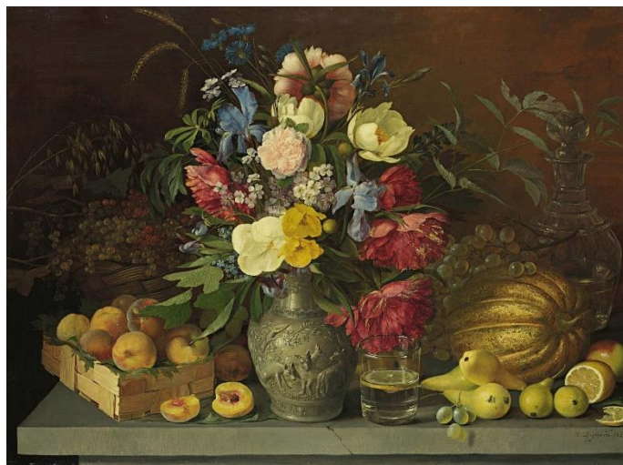
Х.Ф. Хруцкий «Цветы и плоды»

Натюрмортом называют один из жанров изобразительного искусства. Термин произошел от французского nature morte , что переводится как «мертвая природа». На натюрмортах обычно изображают окружающее человека быденные предметы – посуду, книги, цветы, овощи, и фрукты. Мастера группируют их в гармоничные композиции.