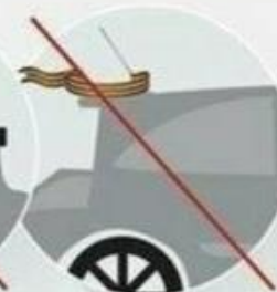
на кузове автомобиля

Помните, ленточка – это не просто кусок ткани. Это символ Победы над фашизмом!