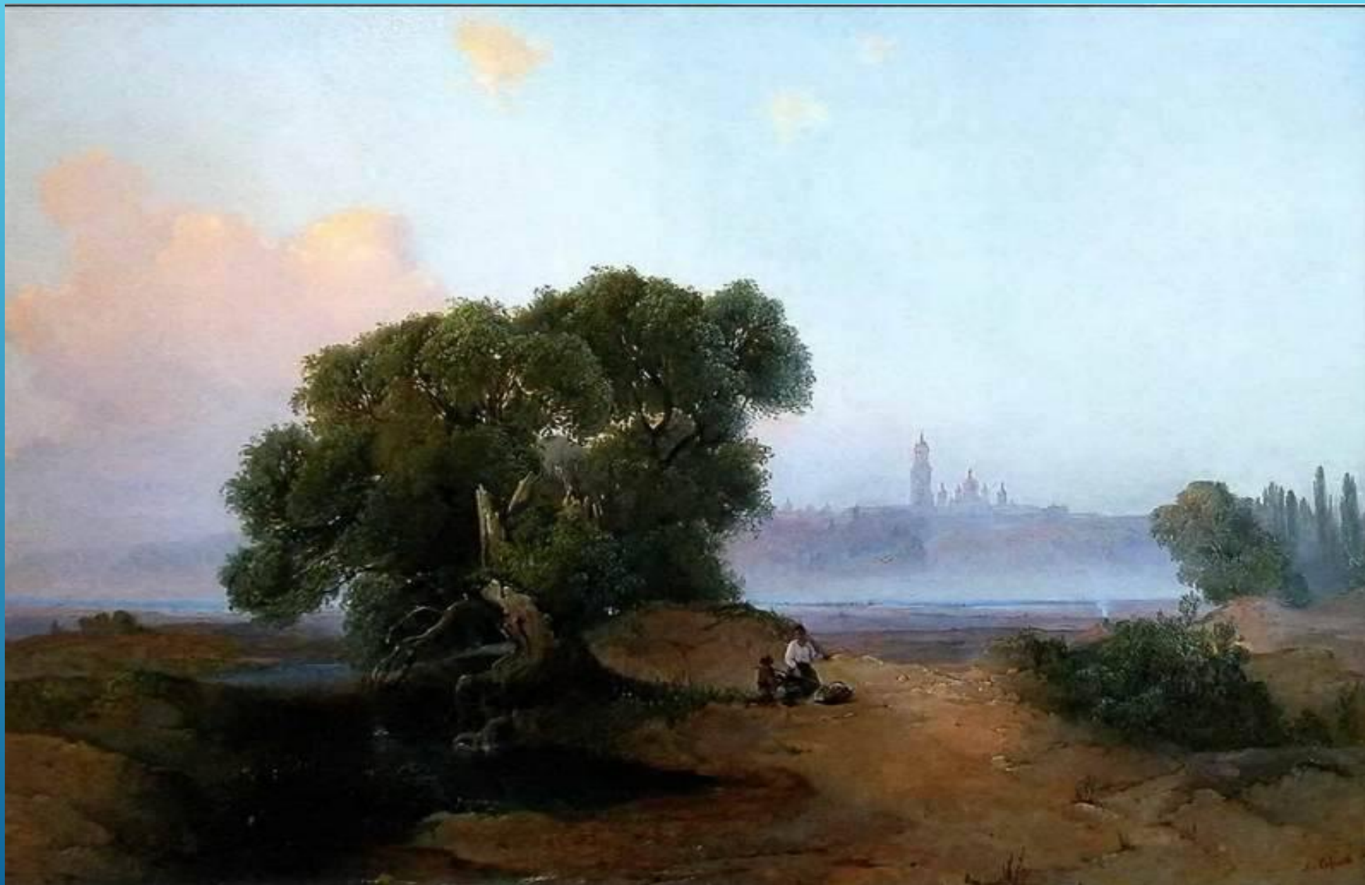
Вид Киева с Днепра на Печерскую лавру. 1852