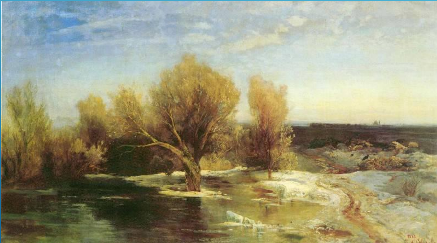
А. К. Саврасов. Весна.

Вот наступил однажды весенний месяц март. Все уже заждались солнышка и тепла, а их все нет и нет. И пошел художник Саврасов в лес, за город, посмотреть, где же весна задержалась. Идет по дороге, по сторонам поглядывает. Как же все некрасиво вокруг! Грязный мокрый снег под ногами хлюпает, земля в проталинах черная, безжизненная. Небо серое, неприветливое, вот-вот пойдет сыпать снегом или дождем. Деревья стоят голые, все какие-то кривые, будто от ветра скрючились.