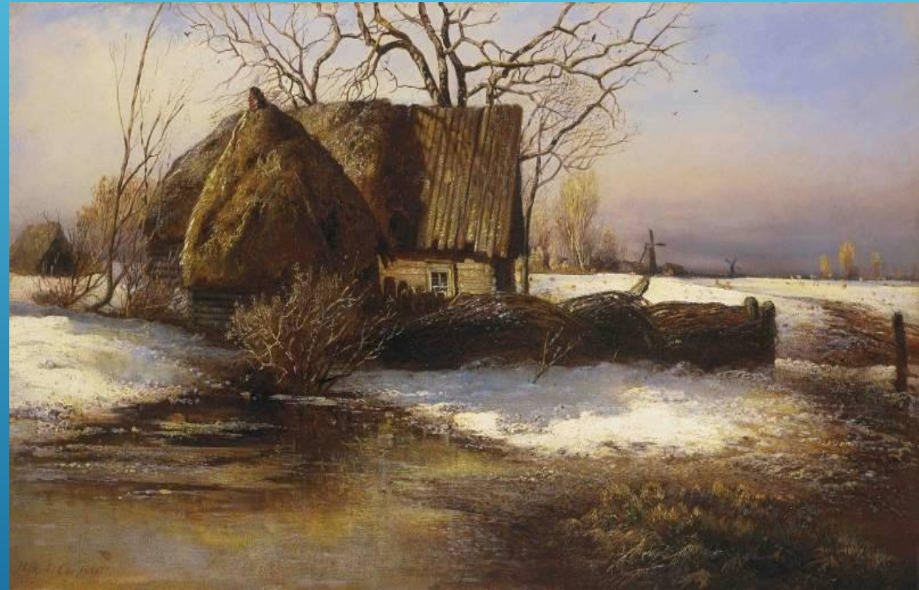
А. К. Саврасов. Скоро весна.