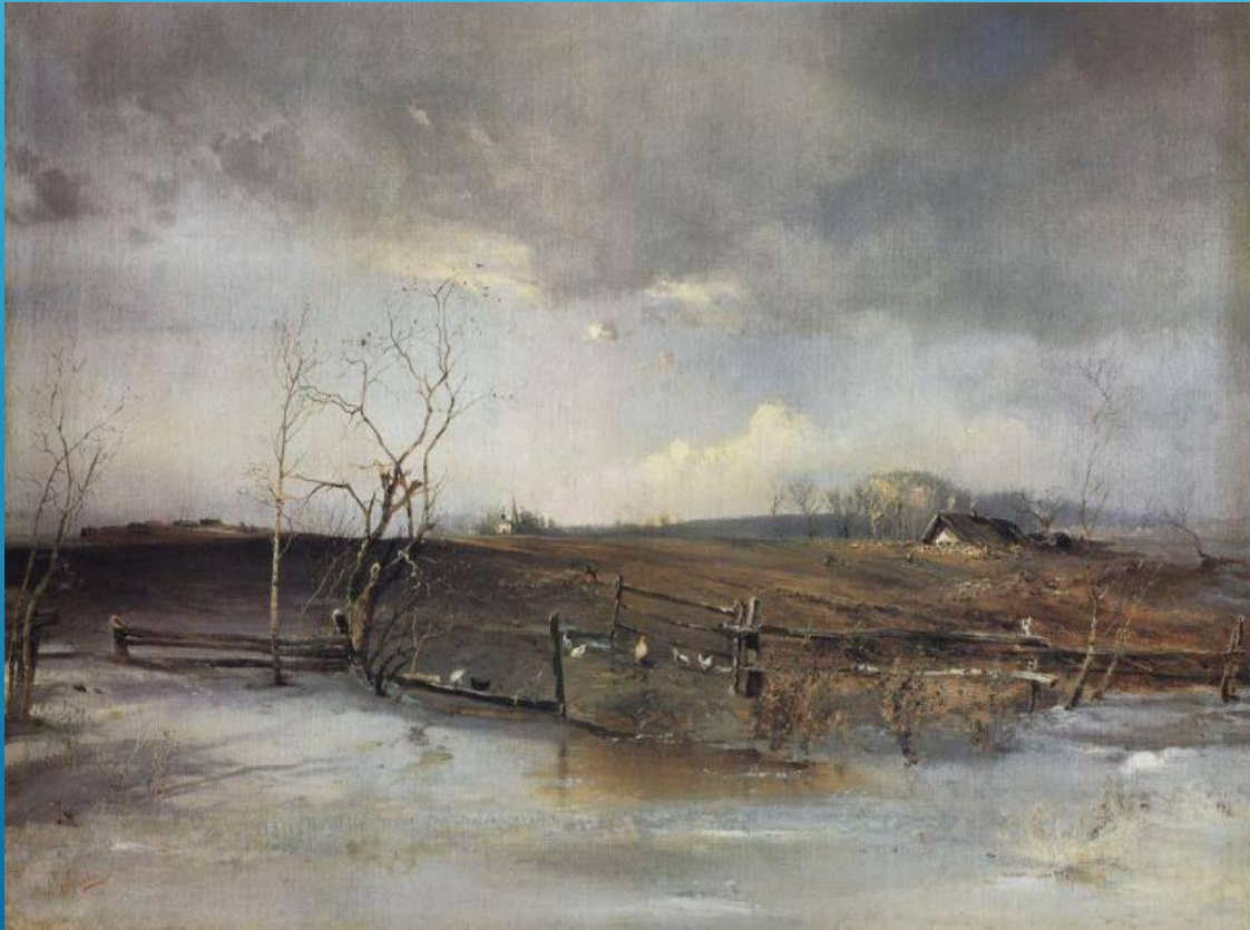
А. К. Саврасов. Весна. Огороды. 1893

Остановился Саврасов... Что же делать-то? Ноги уже совсем промокли, ветер все сильнее да холоднее... На такой стуже кисточку в руках и не удержишь. Да и охоты нет - ни красками писать, ни карандашом рисовать: не годится такой вид для картины.