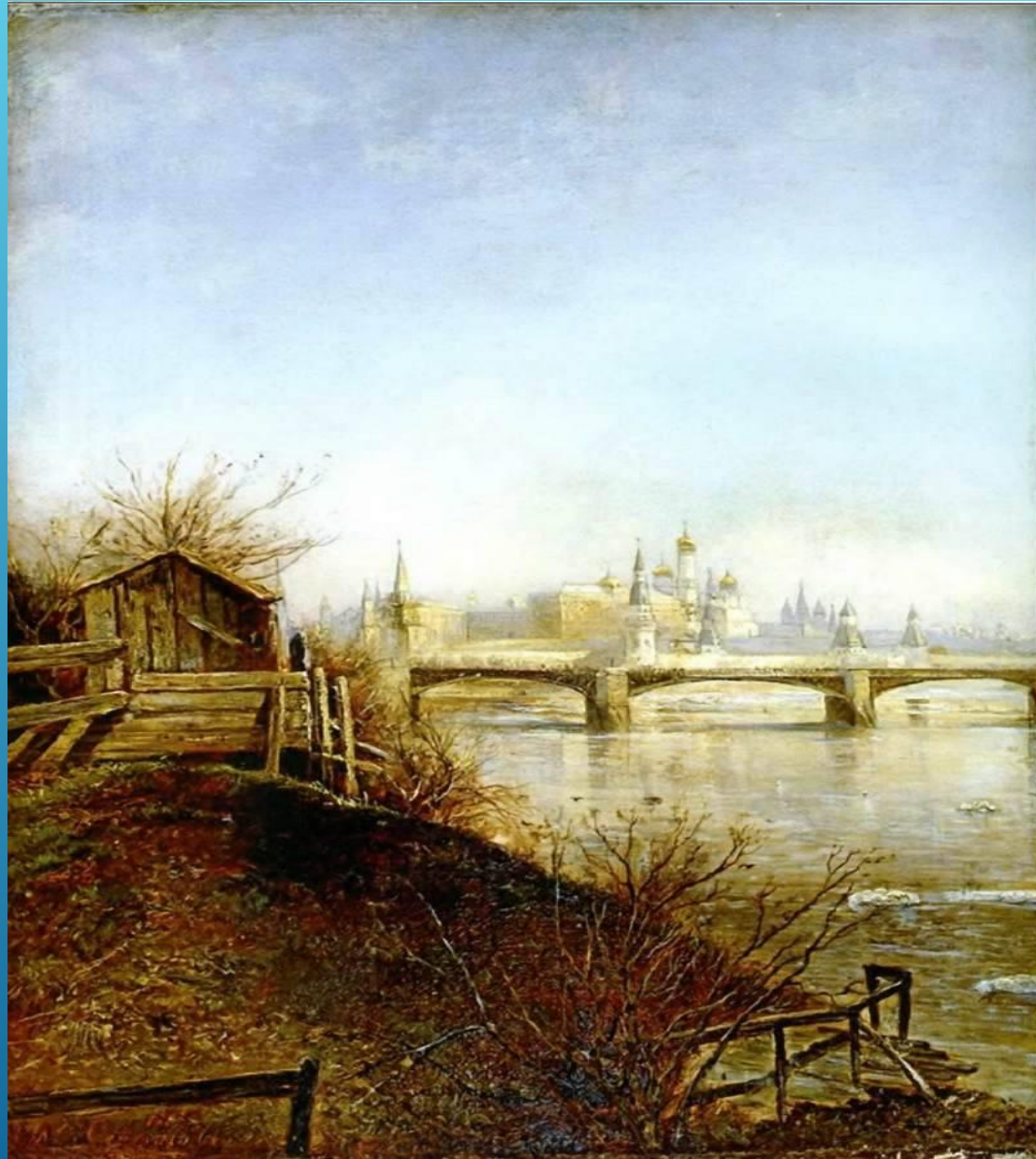
Вид на Московский кремль. Весна 1873