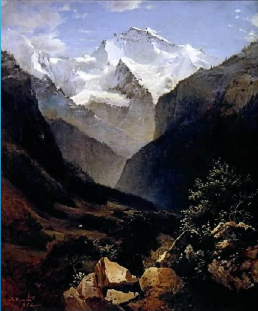
А. К. Саврасов. Вид в Швейцарских Альпах из Интерлакена

То ли дело где-нибудь в Швейцарии! Горы зеленые, реки быстрые да чистые, небо голубое! А какие закаты да восходы! Много написал там Саврасов разных картин.