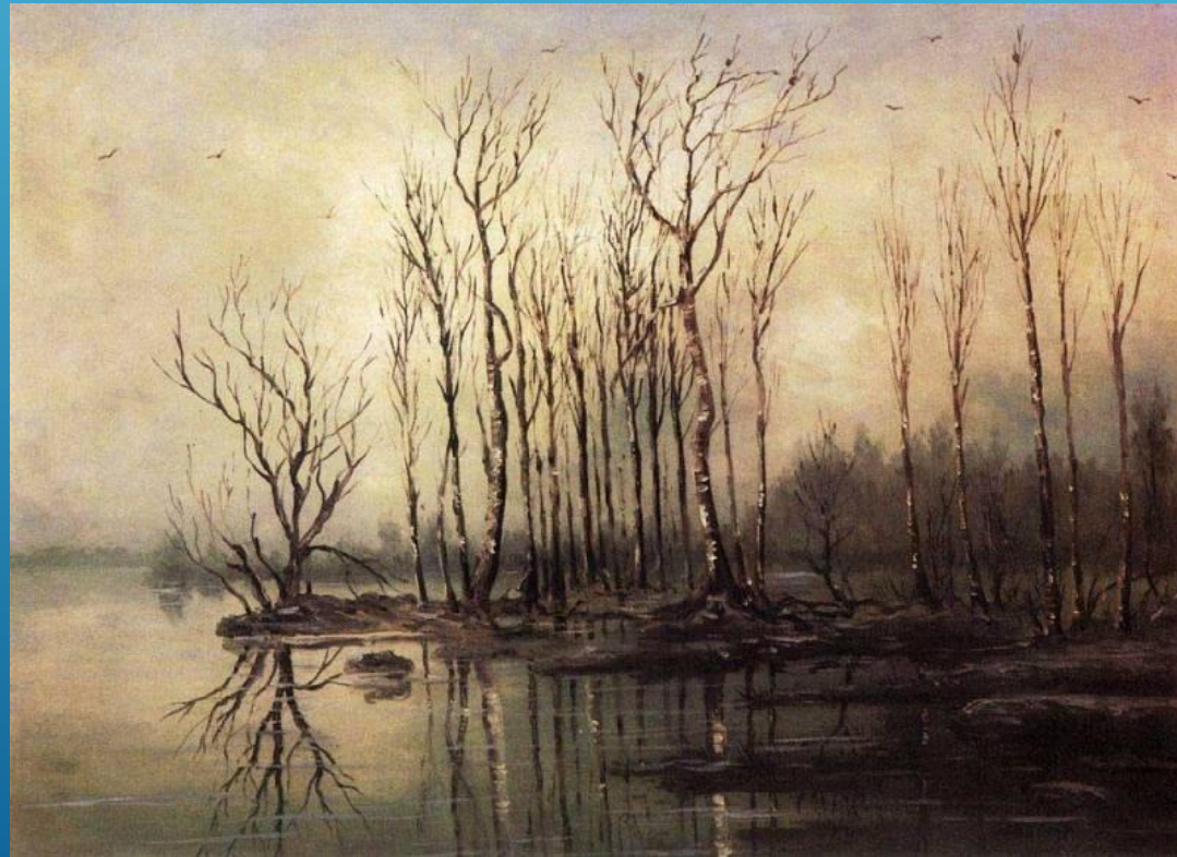
А. К. Саврасов. Ранняя весна. Половодье.

Поднес Саврасов стеклышко к глазам, глянул в него, да так и сел на мокрый снег. Батюшки святы! Что же это случилось? На сердце у него сразу стало тепло-тепло. Вроде уже и ветер утих, и ноги сразу согрелись. А главное, все вокруг совершенно изменилось, а что - он и понять не может. Как будто и деревья те же, и земля, и небо... Но все сразу стало таким удивительно красивым, что невозможно глаз отвести! Голубоватый воздух словно тихо светится. Березки стоят тоненькие, юные, купают ноги в весенних лужицах.