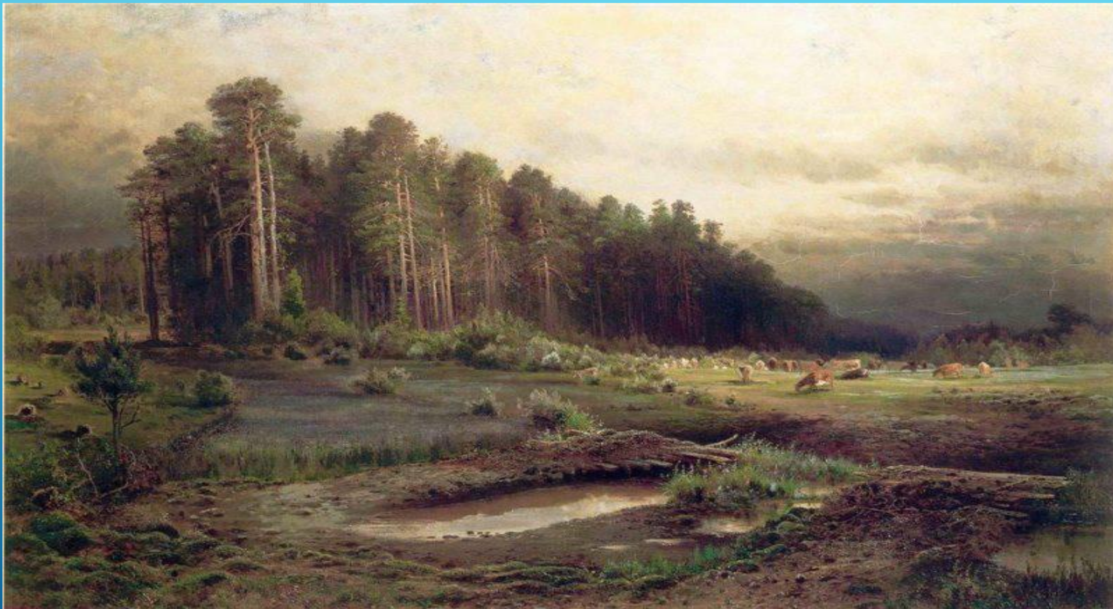
1869 Лосиный остров в Сокольниках. 1869