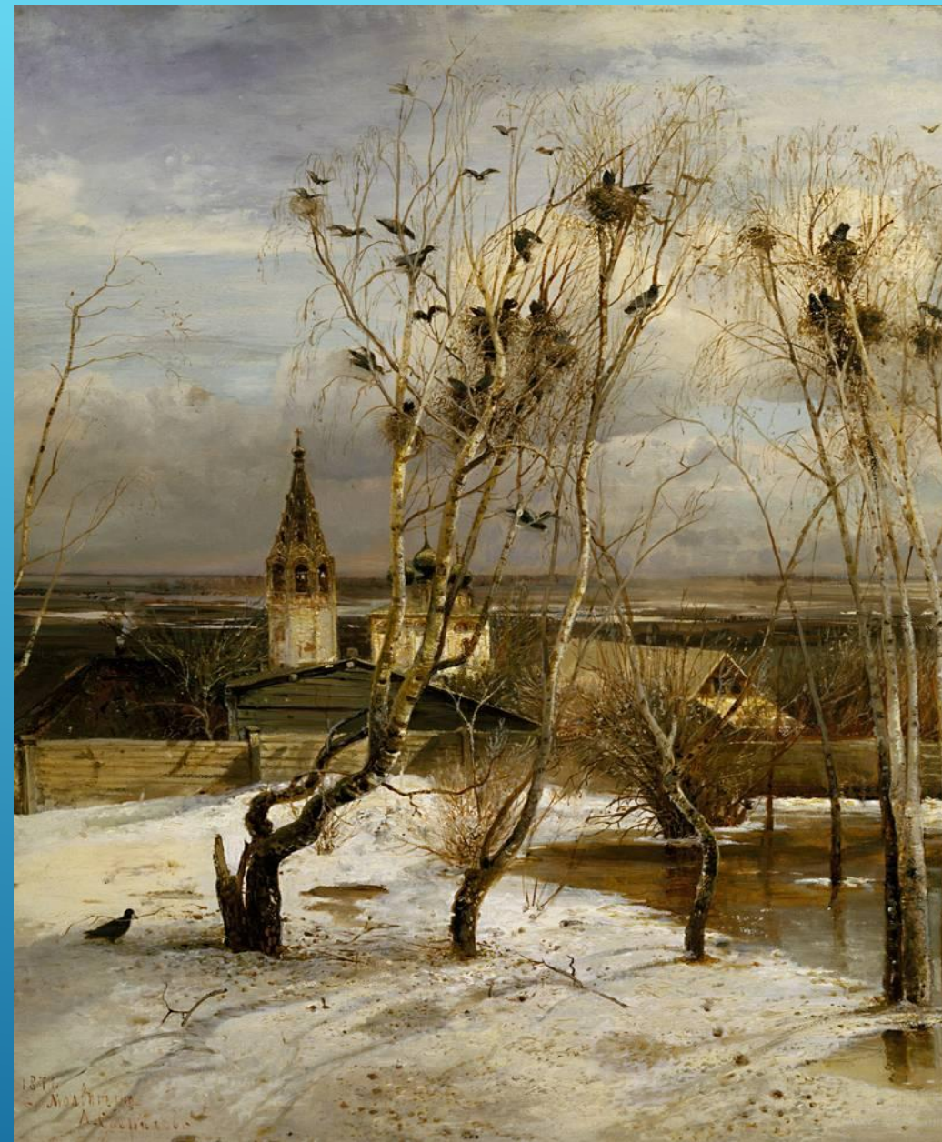
А. К. Саврасов. Грачи прилетели. 1871 г.

- Спасибо за уважение, художник, - важно ответил ему старый грач. - Мы ведь и правда, на крыльях Весну приносим. Сейчас она пошла своего дедушку Мороза навестить, но вот-вот вернуться уж должна. Совсем скоро тепло будет. Ну, до сентября! Уговор дороже денег. Встретимся на этом же месте. Взмахнули крыльями грачи и улетели.