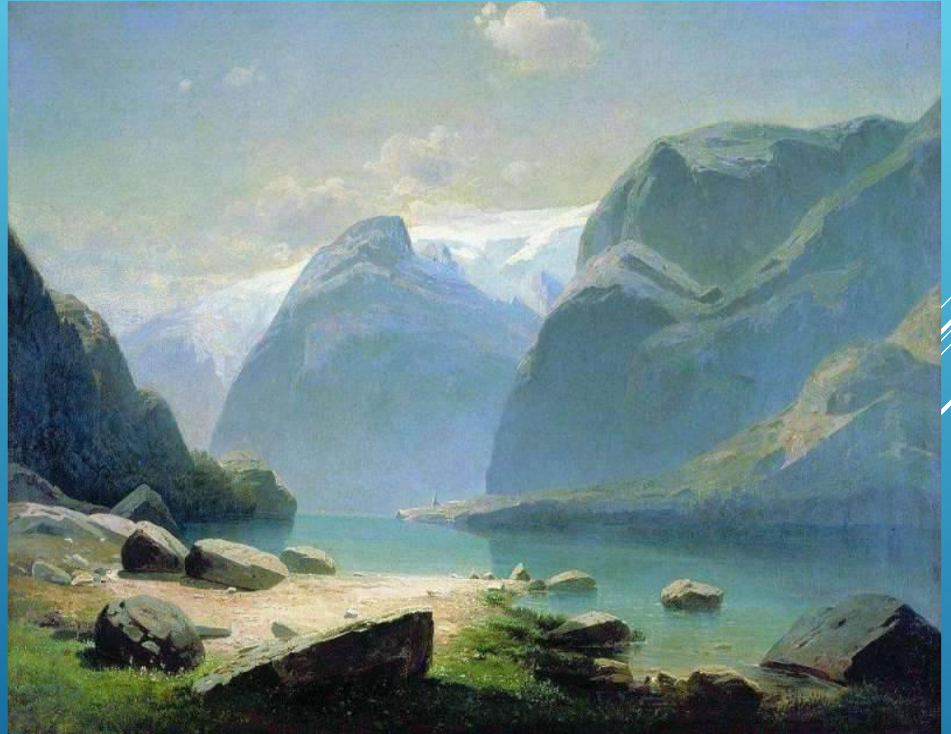
А. К. Саврасов. Озеро в горах Швейцарии.