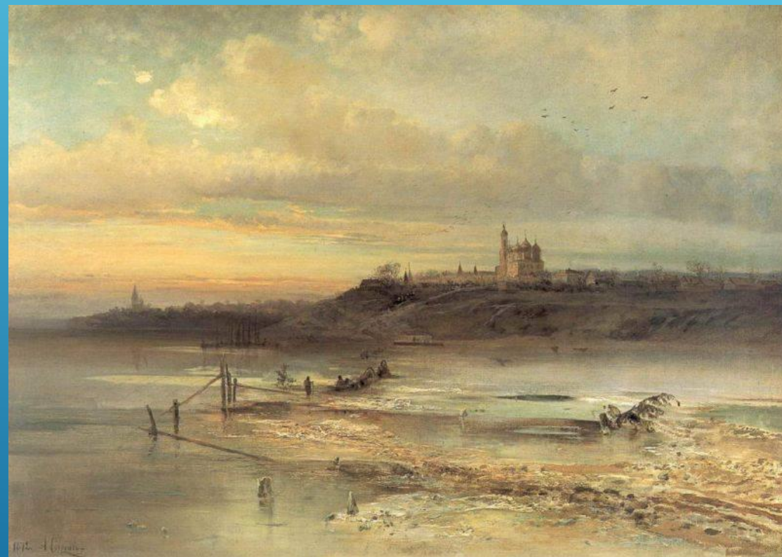
А. К. Саврасов. Оттепель. Ярославль. 1874 год.