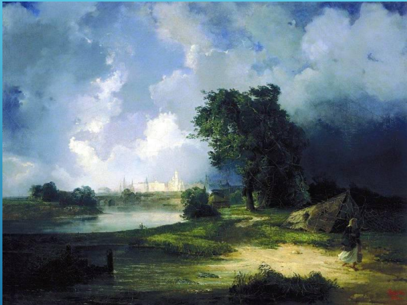
А. К. Саврасов. Вид на Кремль в ненастную погоду.

И на картинах своих Саврасов природу изображал. Такие картины называются «пейзажами», а Саврасов, выходит, был художником-пейзажистом.