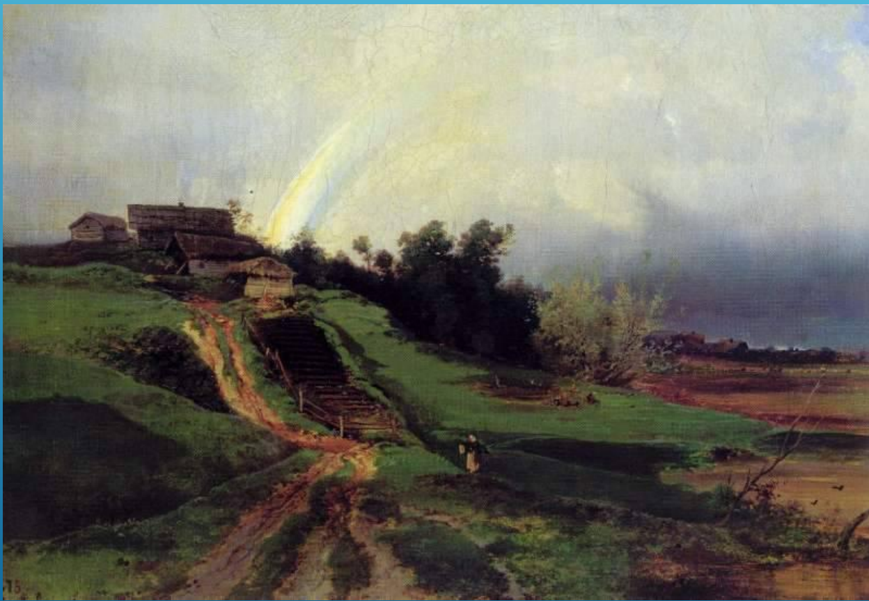
А. К. Саврасов. Радуга. 1875 год.

Но написал он все-таки картину, каких не было раньше в России. Посмотрит на нее любой человек - и его словно солнышко лучом согрело. Вроде и нет ничего особенного - а все свое, милое сердцу. Одним словом - Родина!