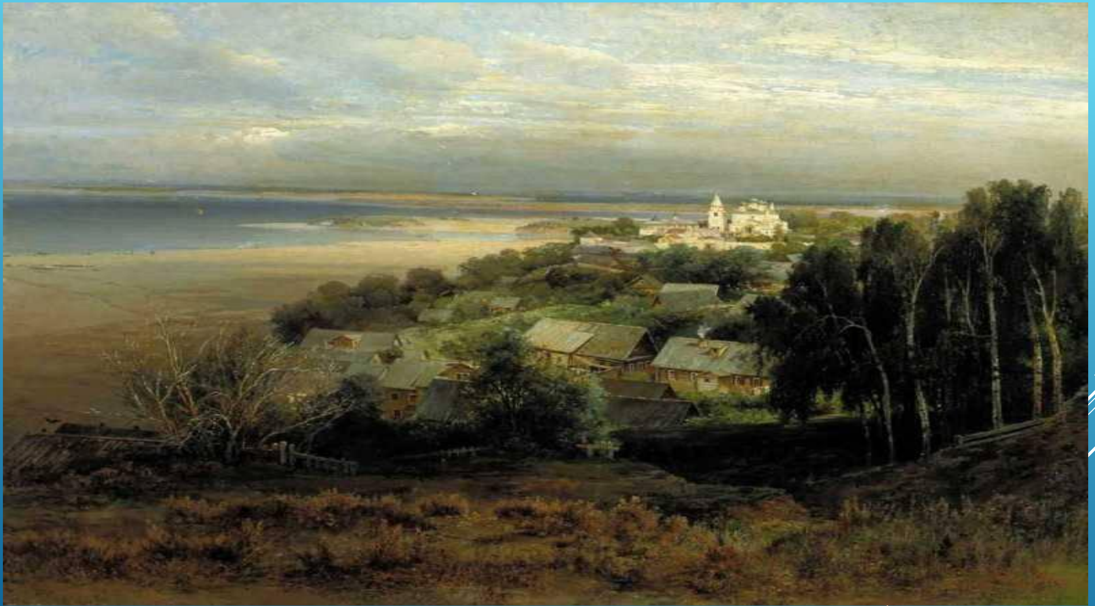
А. К. Саврасов. Печорский монастырь близ Нижнего Новгорода. 1871 год