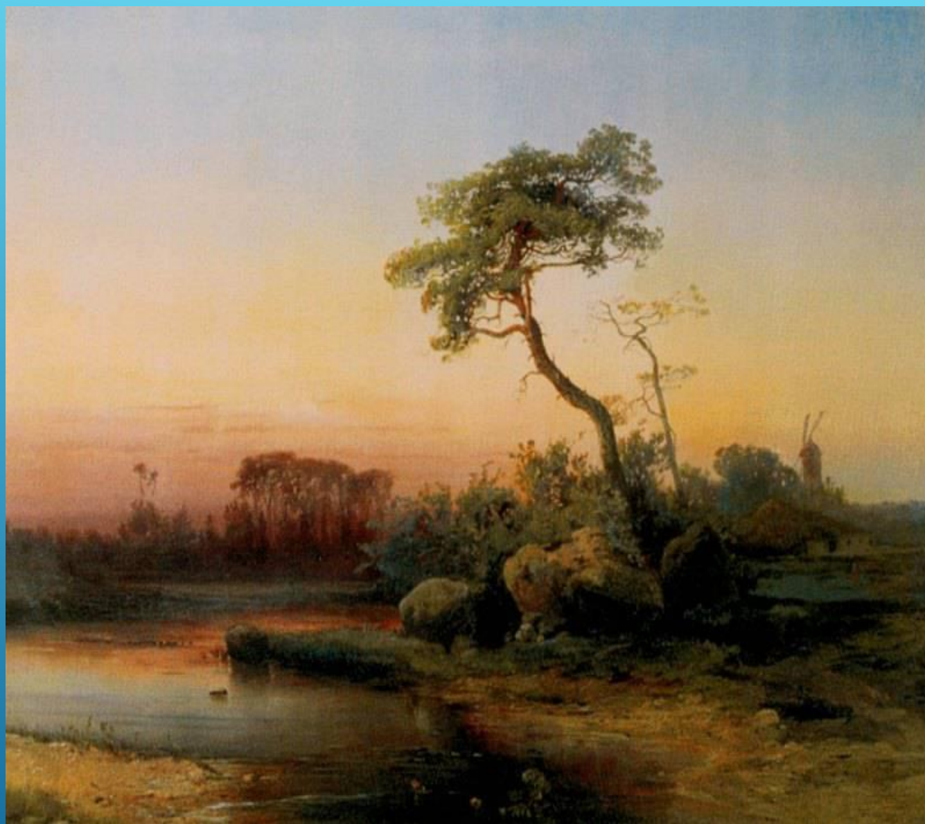
А. К. Саврасов. Пейзаж с сосной.

А как наступил сентябрь; да стали деревья золотыми, отдал Саврасов стеклышко старому грачу, пожелал весенним птицам счастливого пути и счастливого возвращения домой, на родину.