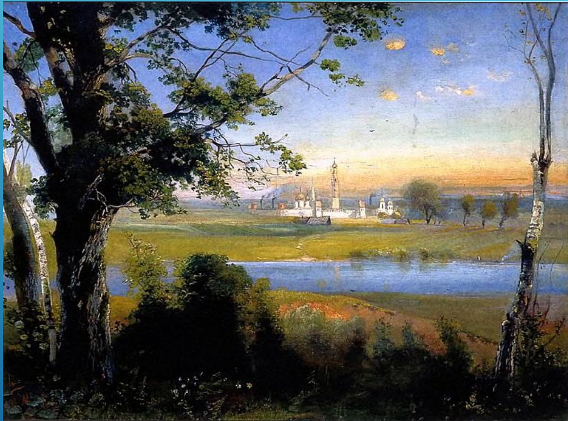
А. К. Саврасов. Новодевичий монастырь.

А Саврасов стоит и чувствует, как тепло по всему его телу разливается. Побежал он домой, поставил на мольберт холст, натянутый на рамку, взял кисти и краски и начал работать. Не сразу у него все получилось. Много раз еще приезжал он и на то место, и в другие деревни ездил, чтобы маленькие зарисовочки- этюды сделать.