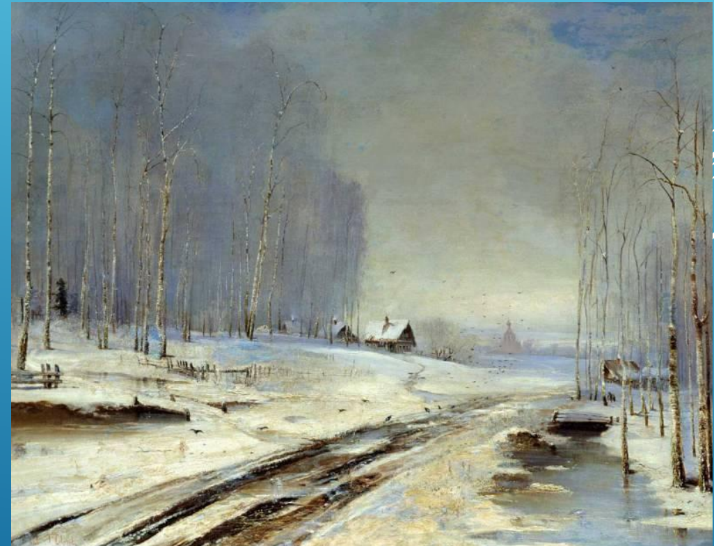
А. К. Саврасов. Распутица. 1874 год.