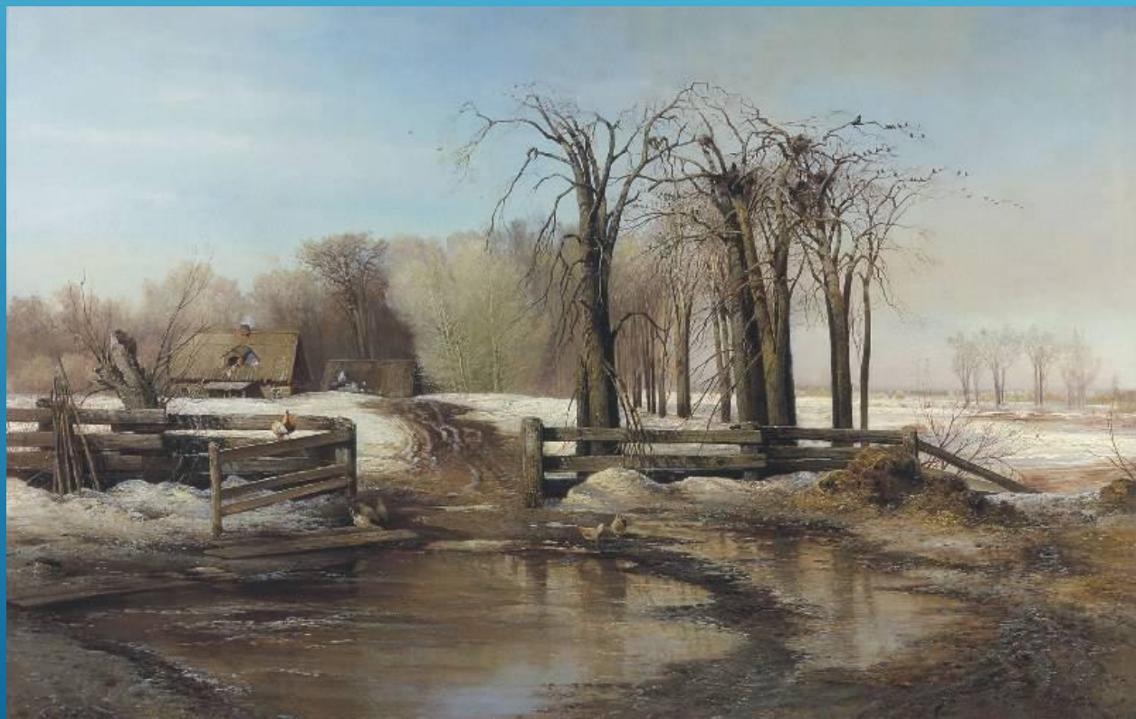
А. К. Саврасов. Весенний день. 1873 год.

Дома вдоль дороги стоят - все маленькие, неказистые, соломенные крыши набок съехали ... А вон церквушка красивая, видно, что старинная, да вся краска облезла от непогоды. Нет, видно, у крестьян денег, чтобы ее покрасить да побелить. А за деревней поля раскинулись - так туда ни конному, ни пешему хода нет, грязь такая, что и шагу не ступишь.