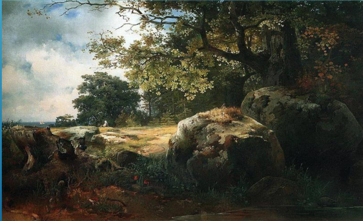
А. К. Саврасов. Вид в окрестностях Ораниенбаума.