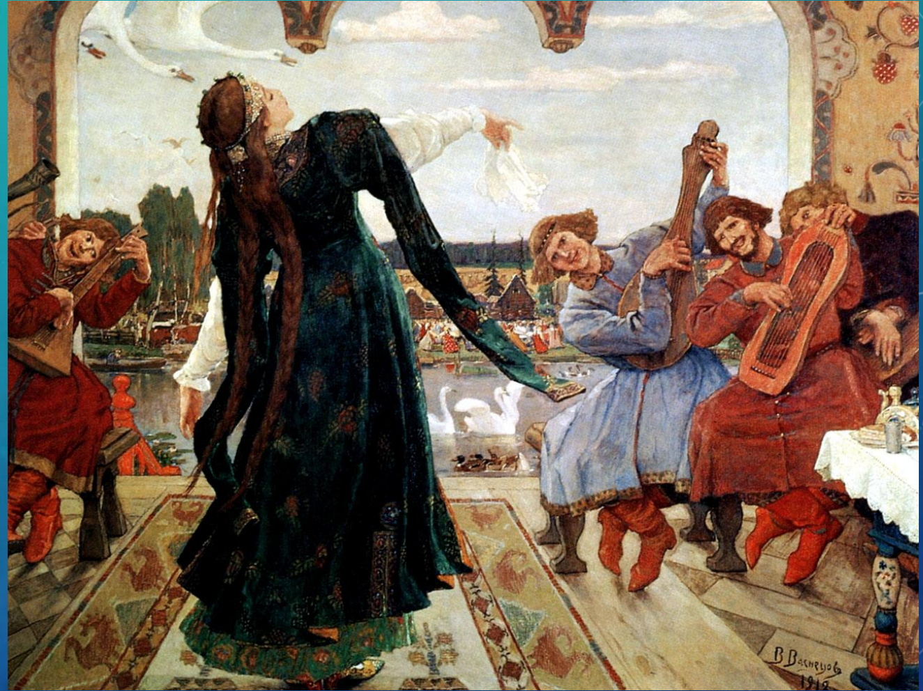
Царевна-лягушка (1918 г.)