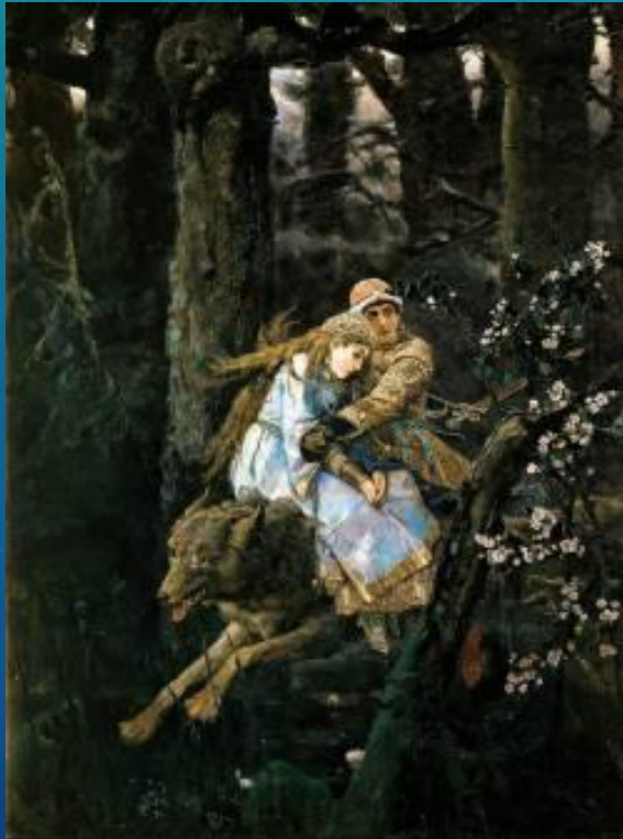
Иван Царевич на сером волке (1889 г.)

ВЗОБРАЛАСЬ ЛИЗА НА ВТОРОЙ ЭТАЖ И ОЧУТИЛАСЬ В ОГРО-О-ОМНОЙ КОМНАТЕ. ПОВЕРНУЛА ГОЛОВУ — ОЙ! — ПРЯМО НА НЕЁ СЕРЫЙ ВОЛК СКАЧЕТ. ПОСМОТРЕЛА В ДРУГУЮ СТОРОНУ — МАМОЧКИ! — ТАМ БАБА-ЯГА В СТУПЕ ЛЕТИТ. СТРА-АШНАЯ! ИЗО РТА КЛЫК ТОРЧИТ. ОБЕРНУЛАСЬ НАЗАД — ЕЩЁ ХУЖЕ: ТАМ КОЩЕЙ БЕССМЕРТНЫЙ НА ТРОНЕ СИДИТ! ШМЫГНУЛА ЛИЗУША В УГОЛ ЗА БОЛЬШОЙ АКВАРИУМ, СЕЛА НА ПОЛ И ГЛАЗА ЗАЖМУРИЛА. БУДЬ ЧТО БУДЕТ!