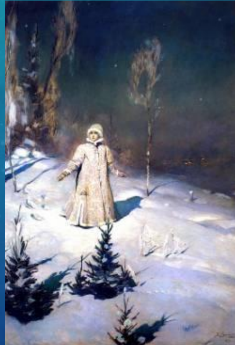
Снегурочка (1889 г.)