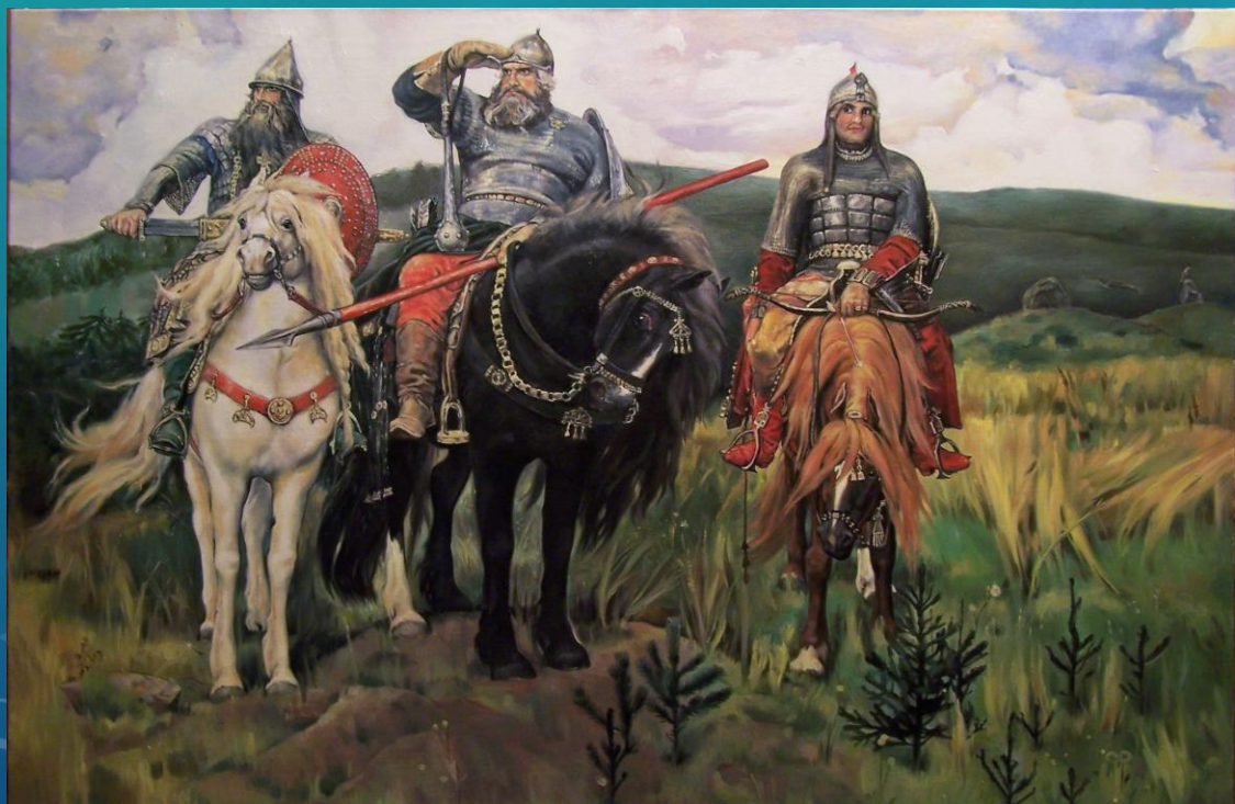
Богатыри (1898 г.)

ТЕ КАРТИНЫ, ЧТО ЛИЗА ВИДЕЛА, КУДА-ТО ПРОПАЛИ, А ПОСЕРЕДИНЕ КОМНАТЫ ПОЯВИЛАСЬ ВДРУГ ДРУГАЯ — ОГРОМНАЯ. А НА НЕЙ ТРИ ВСАДНИКА, ПЕРВЫЙ НА БЕЛОЙ ЛОШАДИ, ВТОРОЙ — НА ГРОМАДНОМ ЧЁРНОМ КОНЕ, А У ТРЕТЬЕГО ЛОШАДКА РЫЖАЯ, ГОЛОВУ ПРИГНУЛА, УШИ ПРИЖАЛА, БУДТО ЗЕМЛЮ НЮХАЕТ. НО, ГЛАВНОЕ, ВСЕ ЖИВЫЕ НА КАРТИНЕ ЭТОЙ. ВСАДНИКИ ТОЛКУЮТ, ДА ПЛОХО СЛЫШНО, О ЧЕМ — ВЕТЕР В КАРТИНЕ СВИСТИТ И ИНОГДА ТАК ПОДУЕТ, ЧТО ДО ЛИЗУШИ ДОЛЕТАЕТ ЗАПАХ ТРАВЫ И МОЛОДЫХ СОСЕНОК.