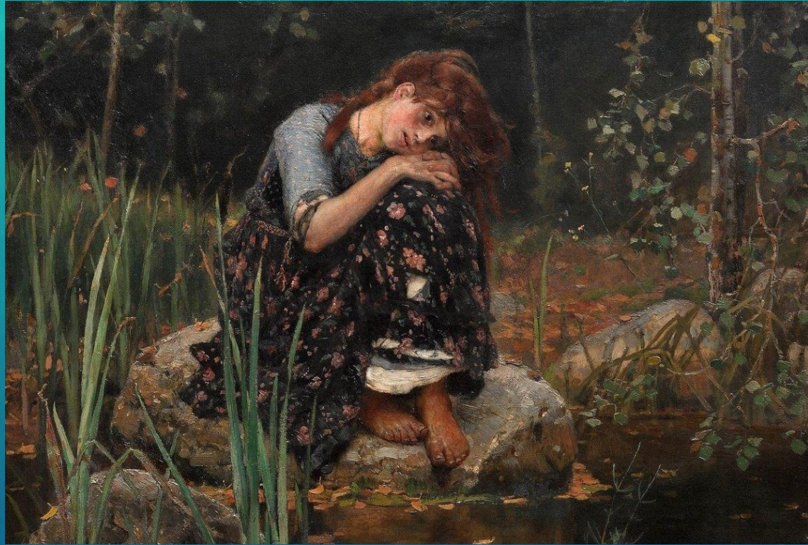
Алёнушка (1881 г.)