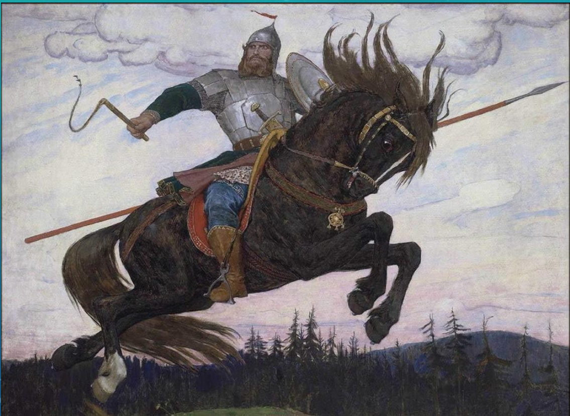
Богатырь (1920 г.)