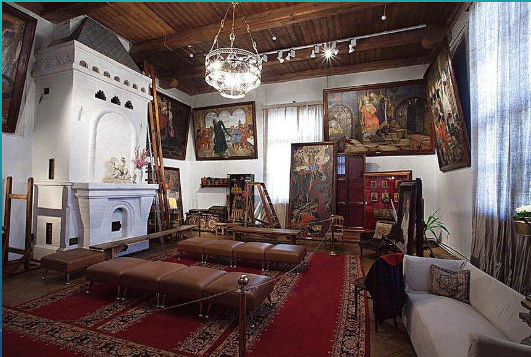
Дом-музей В. Васнецова.