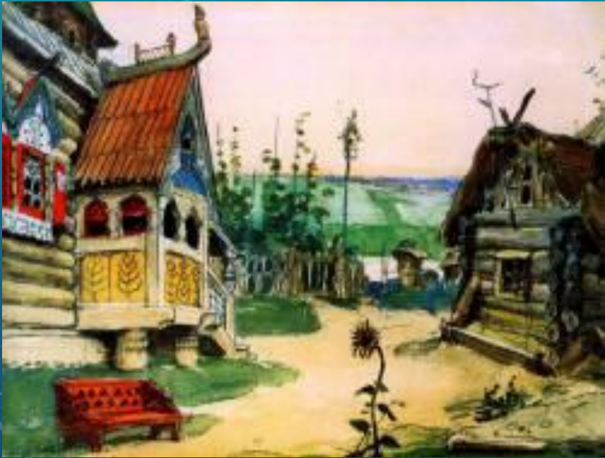
Заречная слободка Берендеевка. Эскиз декорации к опере «Снегурочка» (1885 г.)