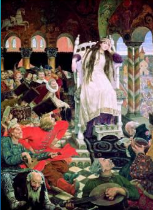
Несмеяна-царевна (1914-1916 гг.)