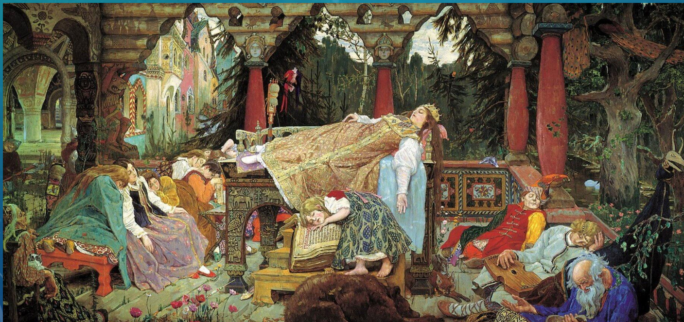
Спящая царевна (1900-1926 гг.)

— А ПОЧЕМУ В МОСКВЕ ДОМ ПОСТРОИЛИ? — УДИВИЛАСЬ ДЕВОЧКА.