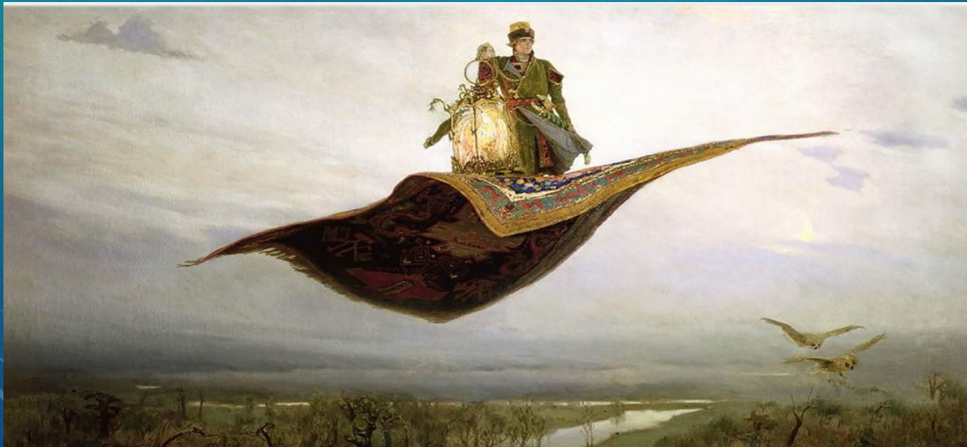
Ковёр-самолёт (1880 г.)

— ТАК ВСЕГДА БЫВАЕТ, ПОКА КАРТИНУ НЕ ЗАКОНЧИШЬ. А КАК СДЕЛАЕШЬ ВСЁ, КАК НАДО, ТАКИМИ ОНИ И ОСТАЮТСЯ НАВСЕГДА.