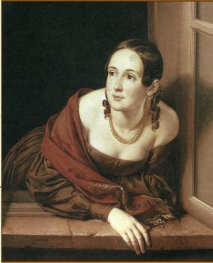
Женщина в окне (Казначейша). Тропинин. 1841г.