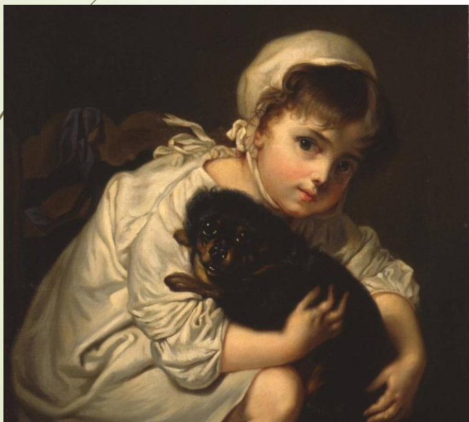
Девочка с собакой. В.А. Тропинин. 1820г.