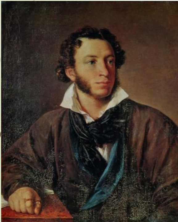
Портрет А.С. Пушкина. В.А.Тропинин. 1829г.

А в конце жизни Тропинин написал свой собственный большой порно всякий, трет. За его спиной – Кремль, в руках – палитра и кисти. Но всякий, кто увидит его круглое лицо, сразу поймет, что Тропинин остался прежним – простым, добрым и сердечным человеком.