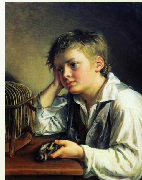
Мальчик, тоскующий об умершей птичке. Тропинин. 1829г.