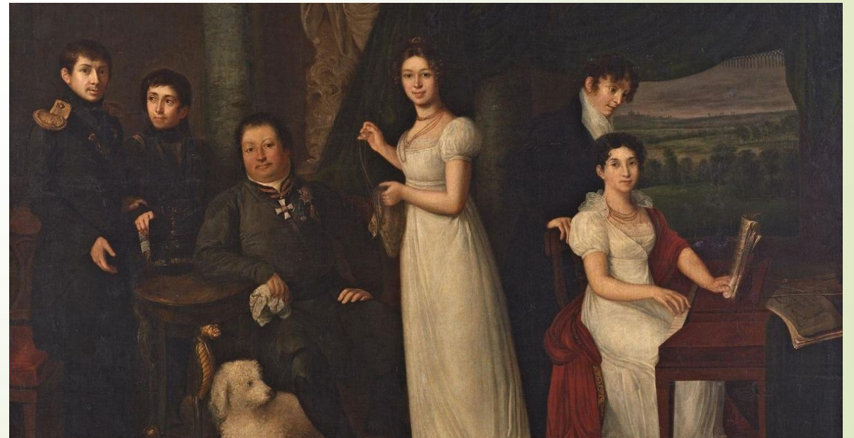
Семейный портрет графов Морковых. В.А.Тропинин 1813г.