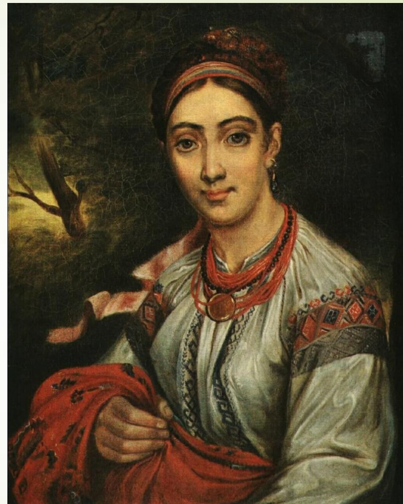
Девушка-украинка. В.А. Тропинин. 1820г.

- Знаю, знаю. Я всю твою жизнь с первой до последней минутки, - тихо сказала женщина. - я ведь Берегиня твоя, всегда с тобой рядом. Вижу, как страдаешь ты, потому и пришла к тебе. Злая у тебя Судьба и трудно мне с ней бороться. Только ты сам можешь мне помочь. - Ты скажи мне только, - взмолился Тропинин, - что ждет меня? Может, и правда, не на что мне надеяться? - Все зависит от тебя - ответила женщина. - Сумеешь неживое живым сделать - быть тебе свободным. Не сумеешь - твоя вина. Это как же понимать-то? - удивился Тропинин. - Намекни хоть чуть-чуть! - Намекнуть-то я могу, чуть улыбнулась Берегиня. - Что ты делать-то хочешь? - Ну, художником хочу быть... - растерялся Тропинин. - А как это по-русски называется! Молчал-молчал Тропинин, а потом сказал задумчиво: - Живописец... Живо... писец! Вот оно что! - То-то! - сказала женщина и погладила его, как маленького, по голове. - Я знаю тебя - от работы ты не бегаешь упорства и терпения не занимать. Не отчаивайся. Ну, прощай пока! И пропала.