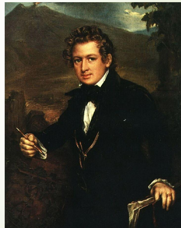
Портрет К.П. Брюллова. В.А. Тропинин. 1836г.