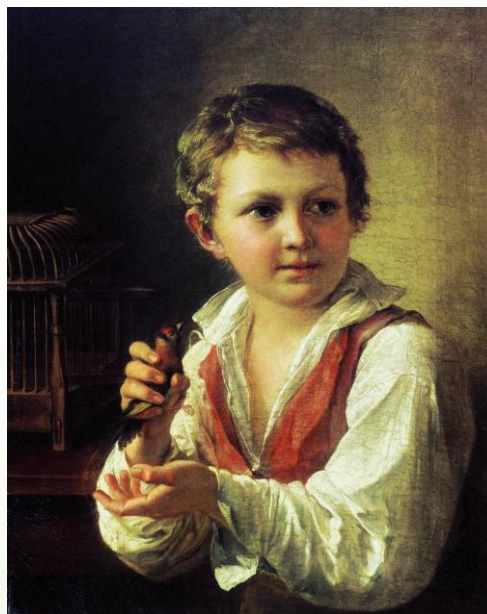
Мальчик с мартовским щеглом. В.А.Тропинин. 1825г.