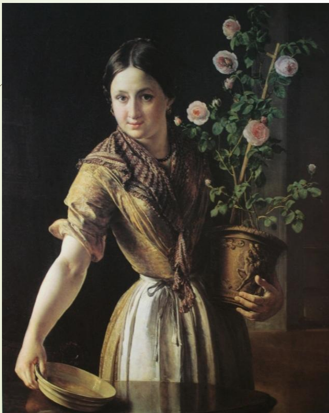
Девушка с горшком роз. Тропинин 1850г.

А Тропинин с того дня пуще прежнего всякую свободную минутку своему искусству отдавал. Сколько раз засыпал прямо там, где работал! Всему он учился сам: и как правильно человека рисовать, чтобы он куклой деревянной не казался, и как краски подбирать, чтобы они на картине превращались в человеческое лицо или блестящие ткани, как кисточкой к холсту прикасаться, чтобы краска тонко и гладко ложилась. И часто художник изображал не только своего хозяина, его детей и богатых знакомых, но и совсем простых людей – и молодых, и стариков.