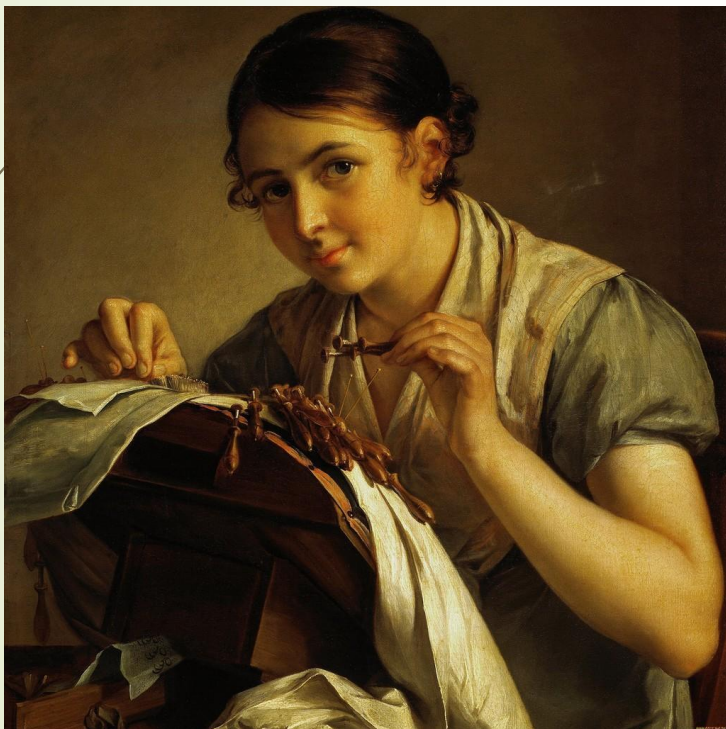
Кружевница. В.А. Тропинин. 1823г.

Оглянулся – опять сидит с ним рядом его Берегиня. Платье на ней вроде понаряднее, и платок серебряной ниткой сверкает.