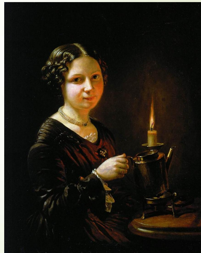
Девушка со свечой. Тропинин 1840г.