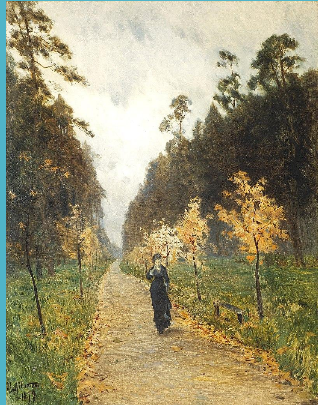
Левитан И. И. "Осенний день. Сокольники." 1879

А ведь сколько раз Солнце посылало ему свои маленькие горячие лучики, чтобы они заставили его развеселиться. Ведь не бывало еще человека, который не играл, хотя бы в детстве, с Солнечными Зайчиками. Но Грустный художник только печально отворачивался, заметив, как они прыгают перед ним на земле или на воде. Поглубже нахлобучивал на свою голову темную шляпу с большими полями или уходил в дом, и ждал, когда наступят сумерки или небо затянется тучами.