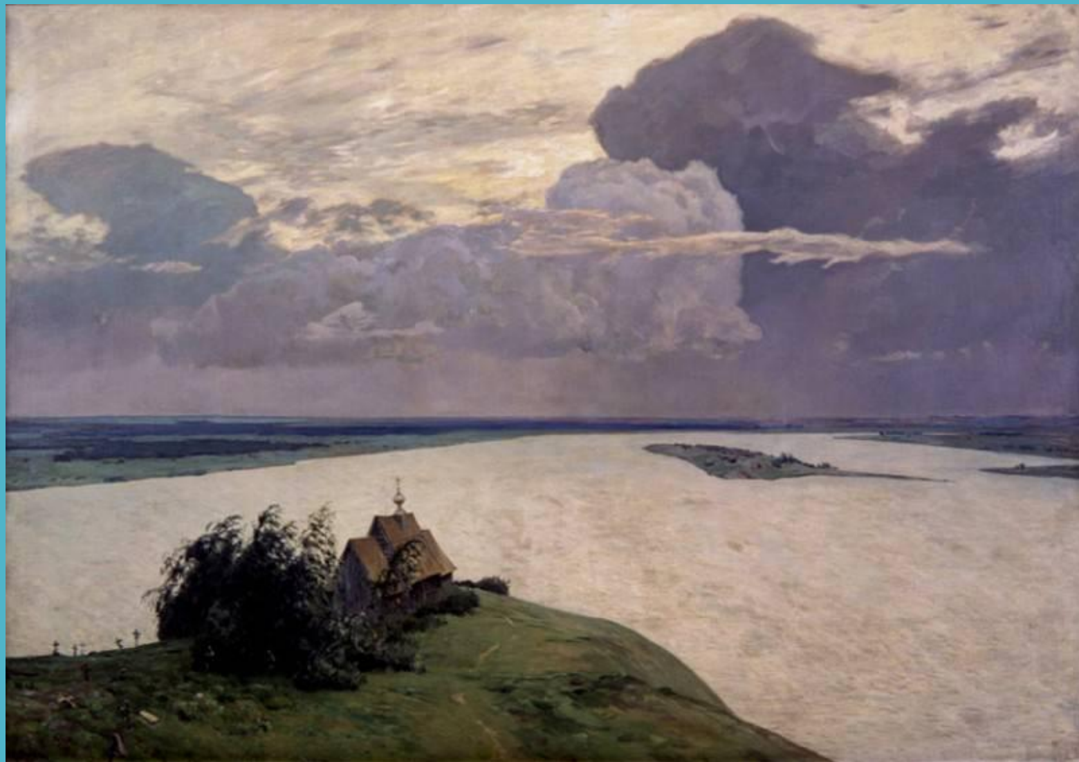
И. И. Левитан. Над вечным покоем, 1894