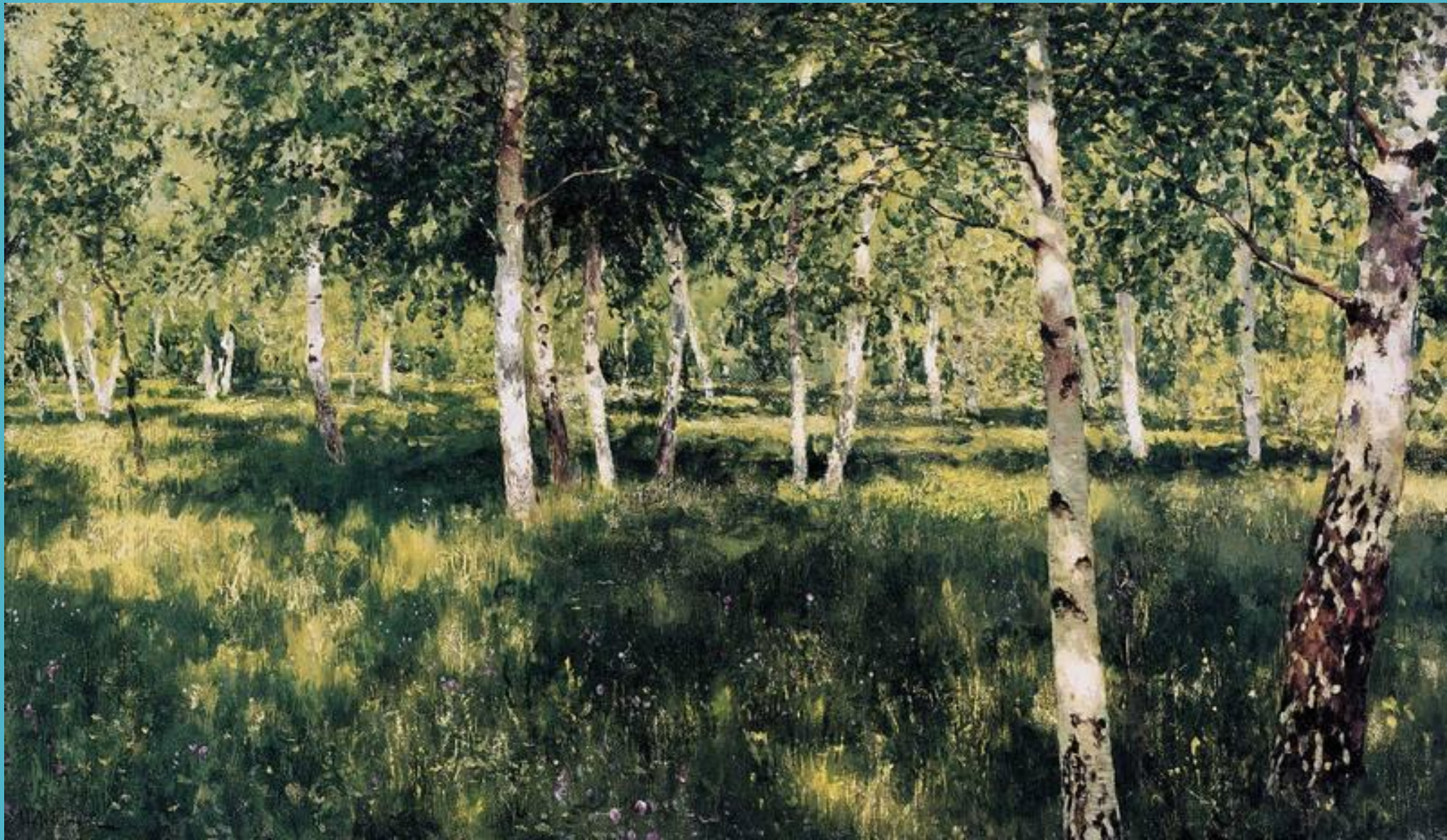
Березовая роща 1885-1889