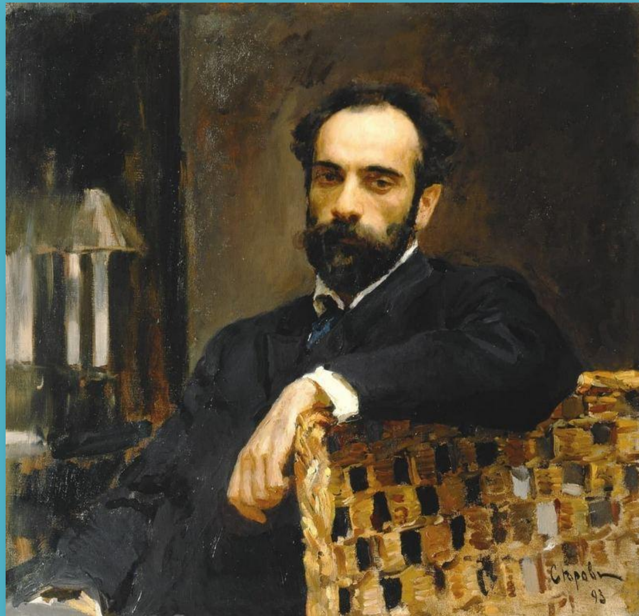
В. В. Серов. Портрет И. И. Левитана