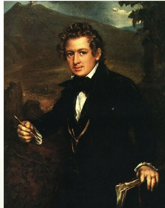
Портрет К.П. Брюллова. В.А. Тропинин. 1836г.