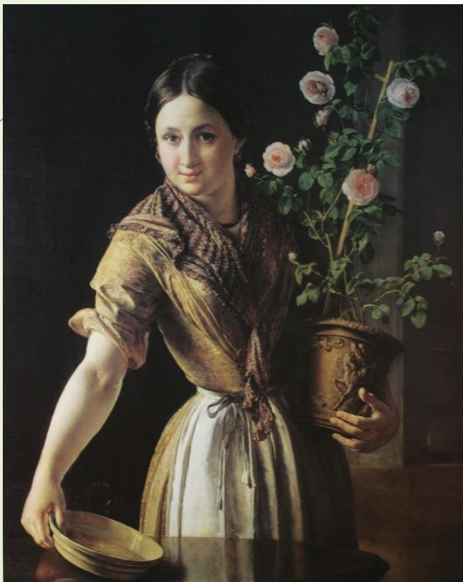
Девушка с горшком роз. Тропинин 1850г.

И часто художник изображал не только своего хозяина, его детей и богатых знакомых, но и совсем простых людей – и молодых, и стариков.