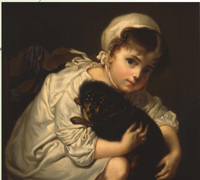
Девочка с собакой. В.А. Тропинин. 1820г.