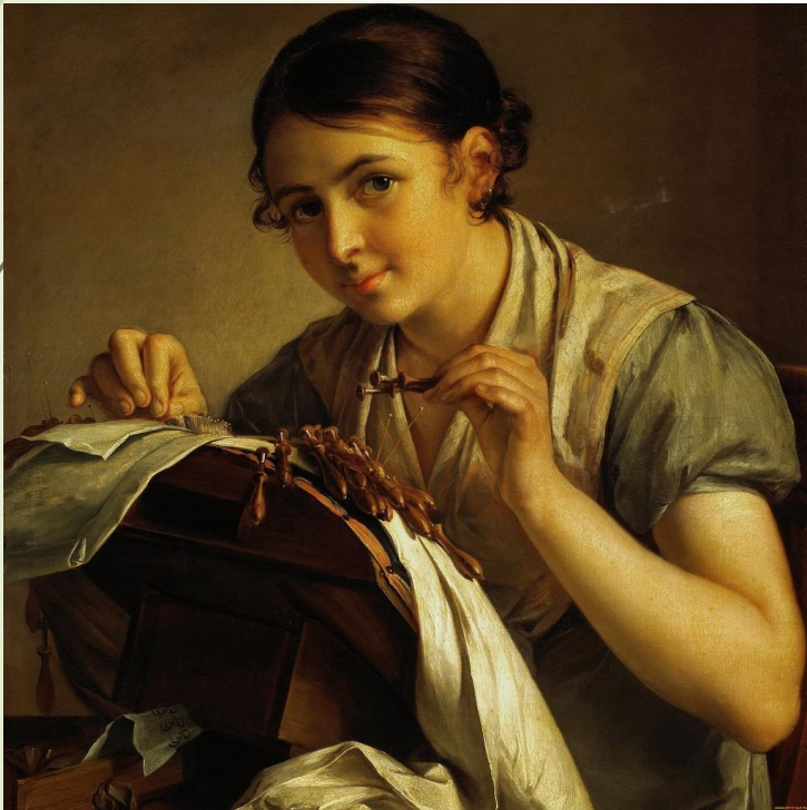
Кружевница. В.А. Тропинин. 1823г.

Оглянулся – опять сидит с ним рядом его Берегиня. Платье на ней вроде понаряднее, и платок серебряной ниткой сверкает.