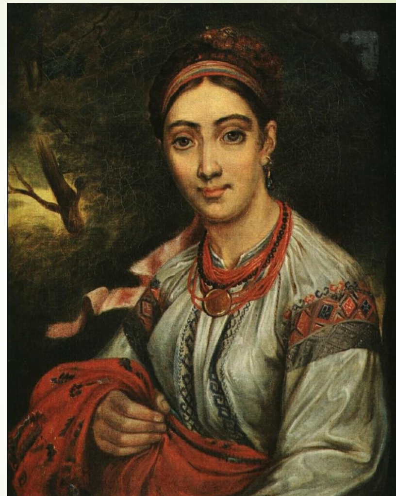
Девушка-украинка. В.А. Тропинин. 1820г.