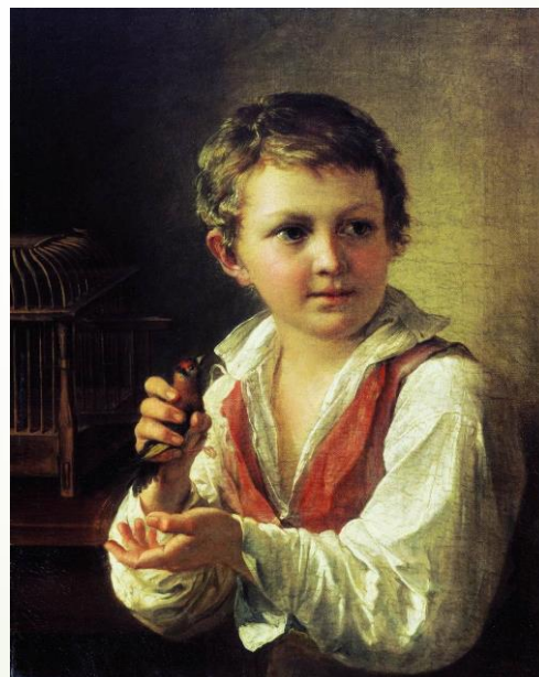
Мальчик с мартовским щеглом. В.А.Тропинин. 1825г.