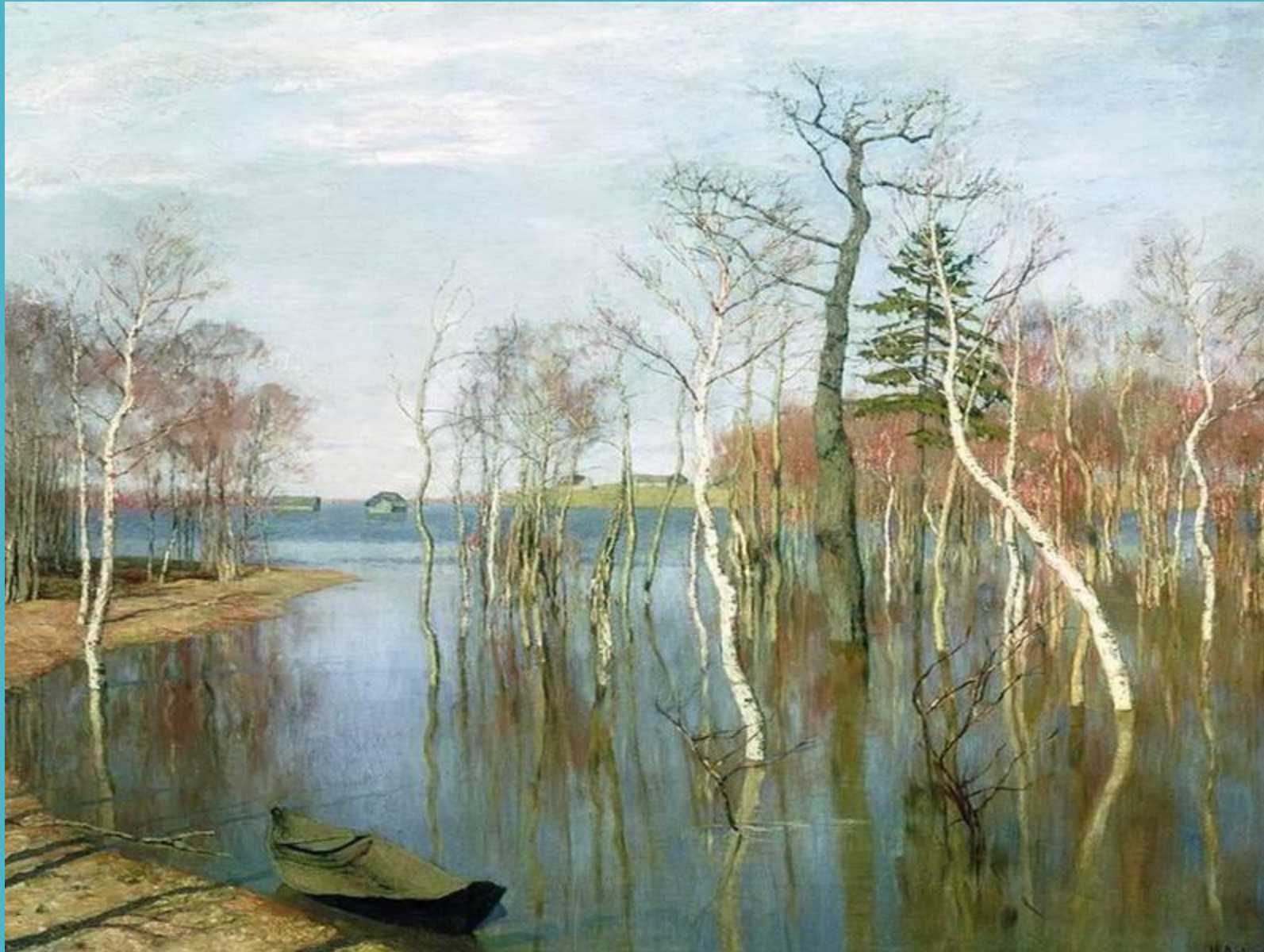
Весна. Большая вода, 1897

А вот и весна! Трогательные тонкие деревья отражаются в воде и оттого кажутся длинными-длинными... Еще холодно, хотя небо уже повесеннему поголубело... Совсем скоро вода сойдет, покажется мокрая земля, засияет солнце, расцветут цветы, распустятся молодые листочки... Но такую привычную, звонкую весну любят все, а Грустному художнику хотелось показать, как прекрасен и serene, зябкий день. Ведь этого никто раньше не замечал.