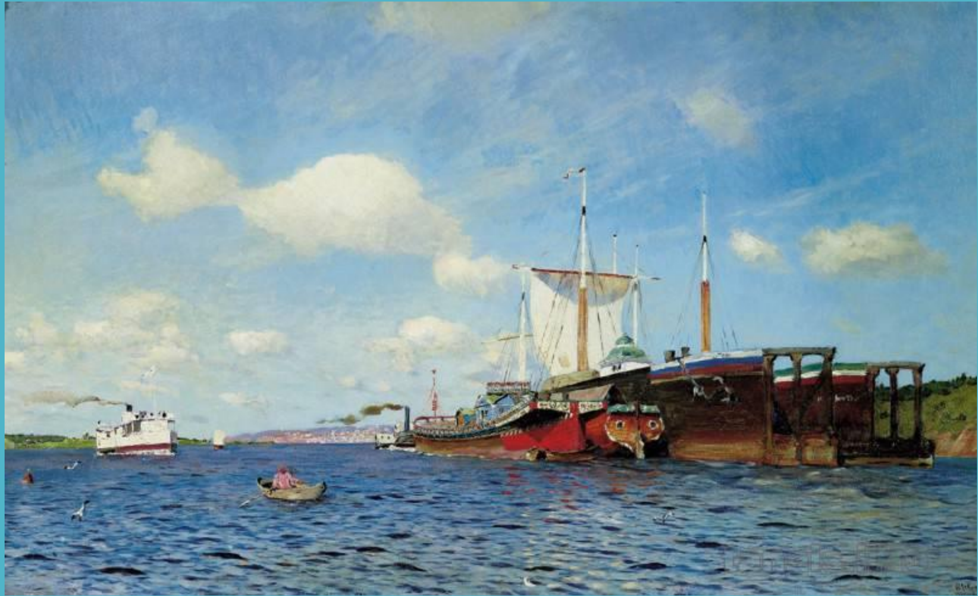
Исаак Левитан. Свежий ветер. Волга. 1895

Вот свежий ветер надувает паруса залитого Солнцем красавца корабля на большой реке. В небе бегут пушистые облака, река вся покрыта мелкими, быстрыми волнами. Все так нарядно, бодро, весело! Даже и не верится, что эту картину написал Грустный художник.