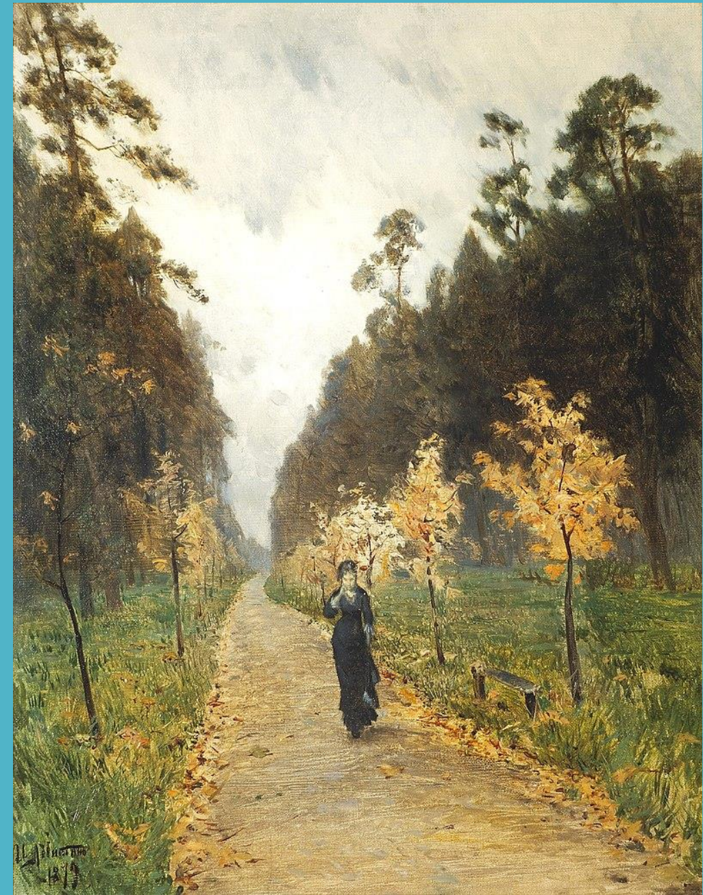
Левитан И. И. "Осенний день. Сокольники." 1879

А ведь сколько раз Солнце посылало ему свои маленькие горячие лучики, чтобы они заставили его развеселиться. Ведь не бывало еще человека, который не играл, хотя бы в детстве, с Солнечными Зайчиками. Но Грустный художник только печально отворачивался, заметив, как они прыгают перед ним на земле или на воде. Поглубже нахлобучивал на свою голову темную шляпу с большими полями или уходил в дом, и ждал, когда наступят сумерки или небо затянется тучами.