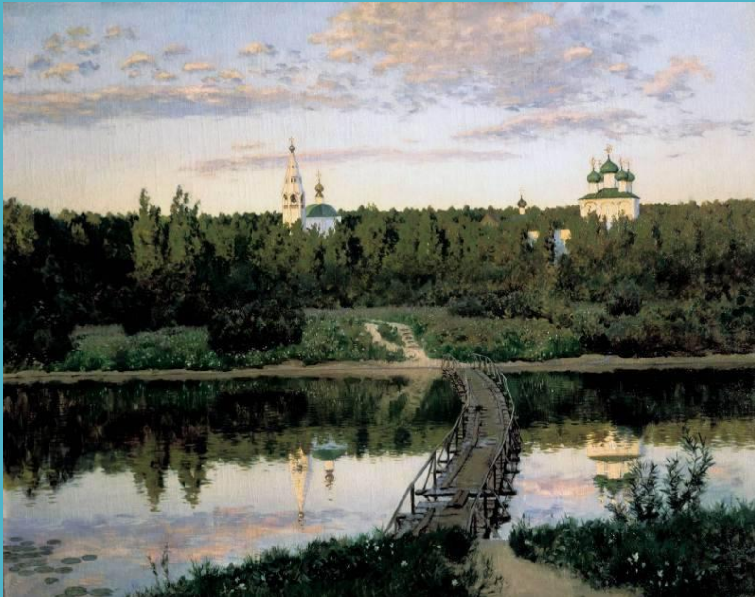
Тихая обитель 1890

Жил-был Грустный художник. А грустен он был потому, что уж очень невеселая была у него жизнь. Он мечтал стать художником, а на художника учиться ох как долго! Сначала надо научиться рисовать, потом писать красками, а потом еще суметь делать это так, как до тебя никто не умел. Понятно, что на все надо много времени.