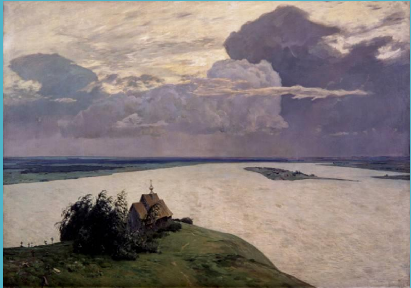
И. И. Левитан. Над вечным покоем, 1894