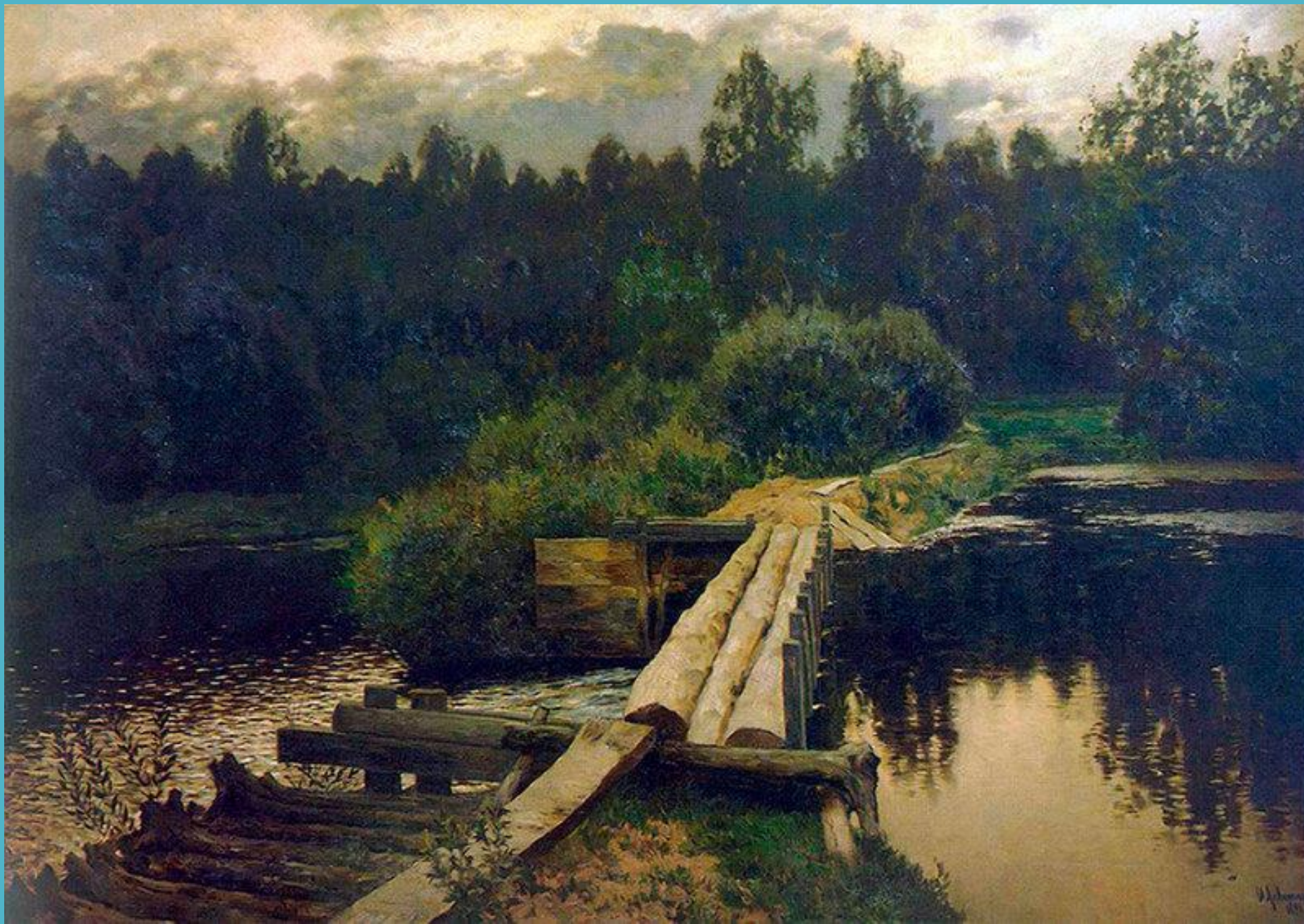
У омута. 1892 год