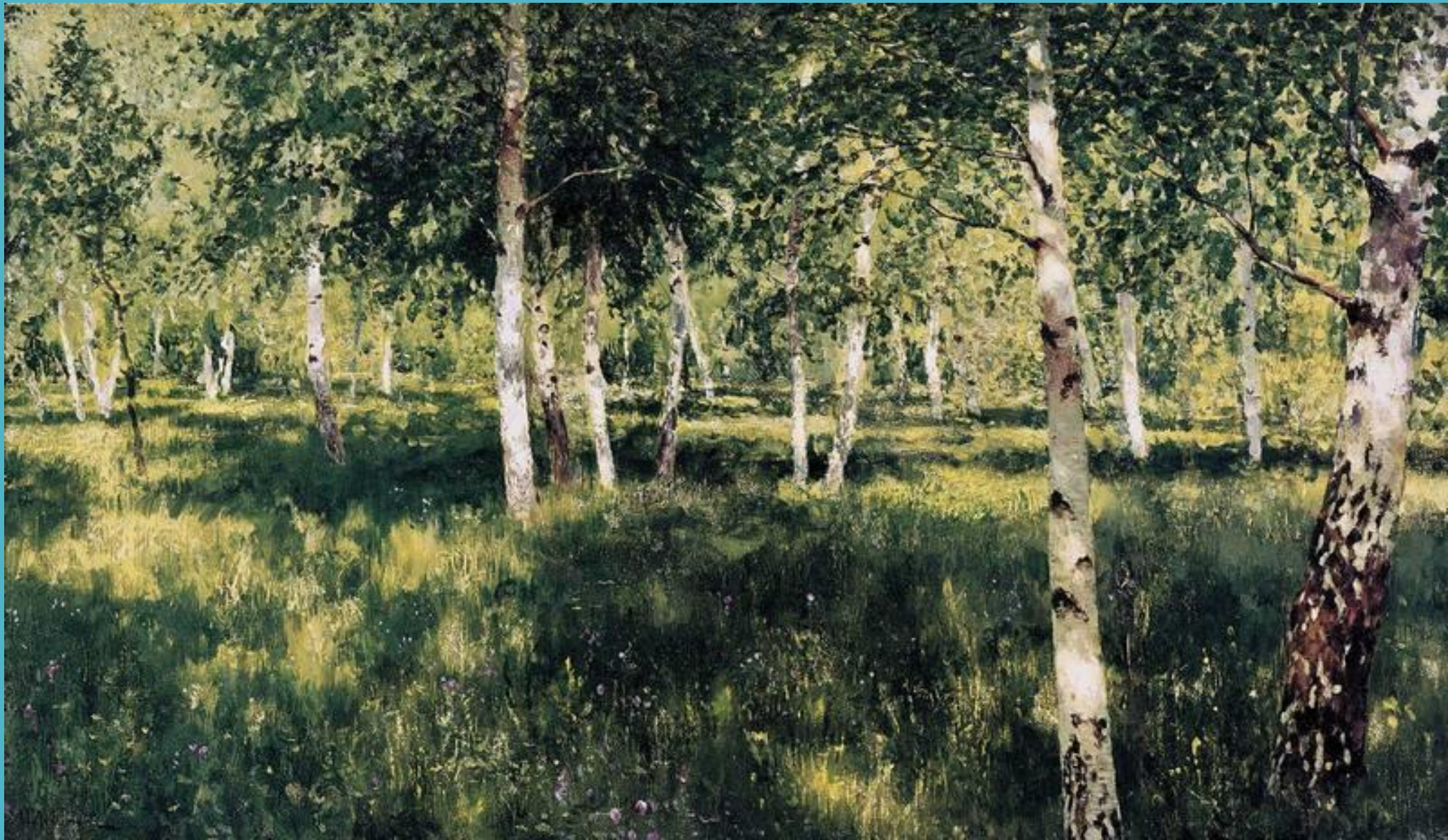
Березовая роща 1885-1889