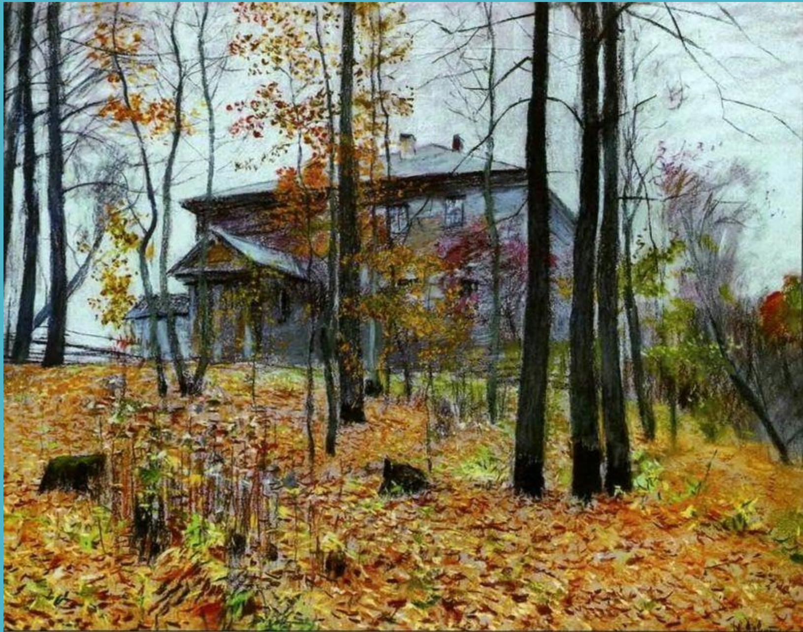
Осень. Усадьба 1894