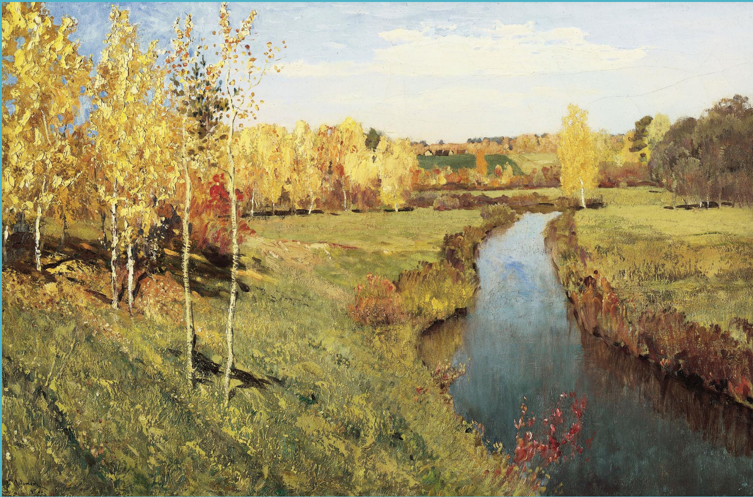
Золотая осень. 1895

А вот — золотая осень. Это когда листья на деревьях уже пожелтели, но еще не опали. И когда в такой осенний день выглядывает Солнце, весь лес будто горит — такие огненные цвета у листьев — багровый, желтый, красный, оранжевый! Красиво так, что дух захватывает! Голубое холодное небо, спокойная вода речки, золотые березы. И снова все-таки немножко... грустно. Уж слишком недолговечна эта красота. День-два — и ударят морозы, покроется инеем трава, поблекнут цвета. Но художнику все-таки удалось остановить этот день навсегда. Удивительно, правду? А если подойдешь поближе, то прочитаешь подпись на картине: Исаак Левитан. Так звали того Грустного художника.