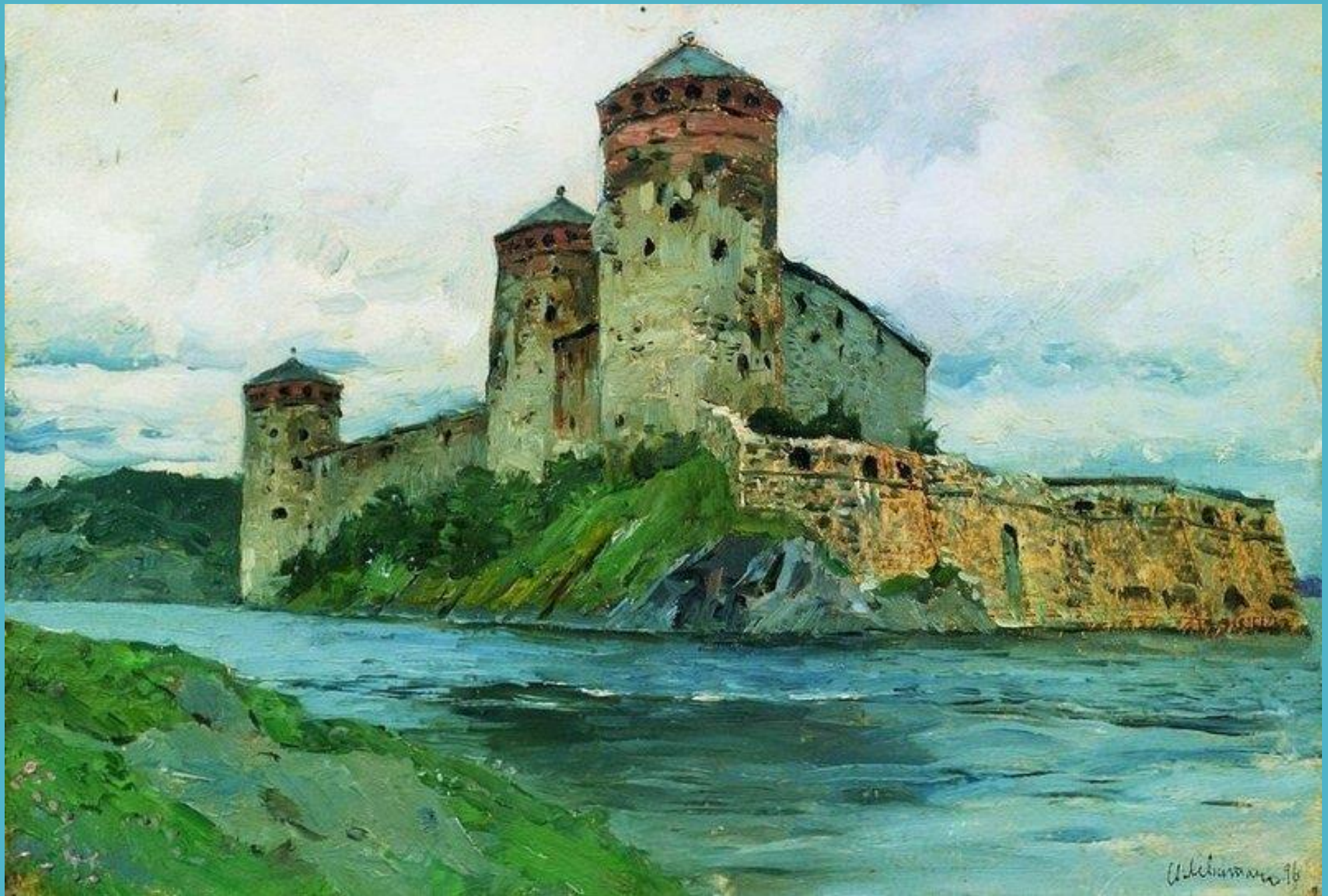
Крепость в Финляндии. 1896. Исаак Левитан.